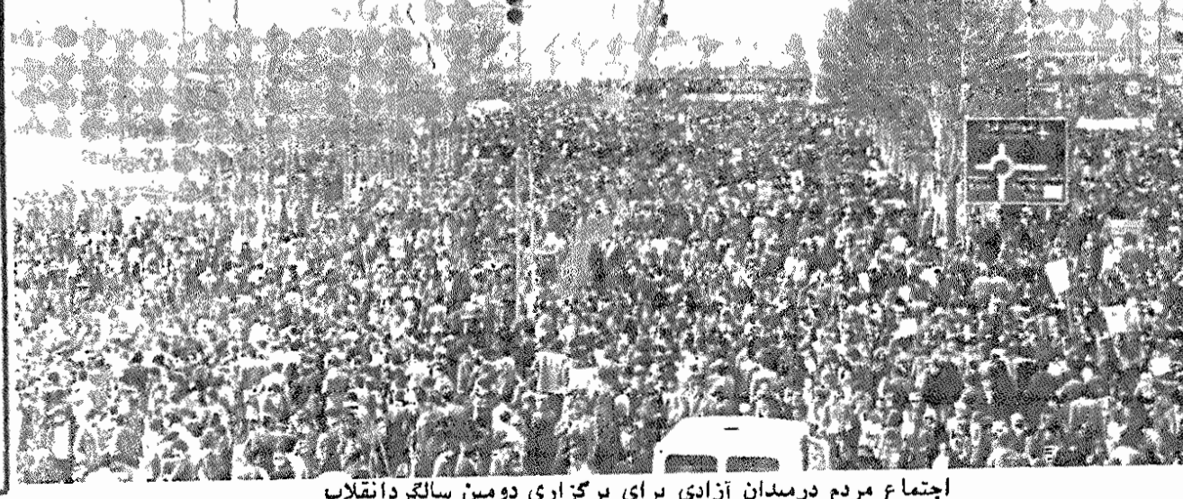
اجتماع مردم در میدان آزادی برای برگزاری دومین سالگرد انقلاب

در میانه میدان نیز تصویر در هم شکسته‌ای از پرچم آمریکا قرار داشت که روی آن نوشته شده بود: «دوستان آمریکا، فتودال، لیبرال، سرمایه دار وابسته، زمیندار بزرگ» بر اساس گزارش خبرنگاران نامه «مردم» همراه دسته‌های بزرگ مردم، کارناوال‌ها هم در حرکت بودند. دیروز دهها کارناوال که در آنها به شکل‌های گوناگون امپریالیسم آمریکا و بقیه در صفحه ۲