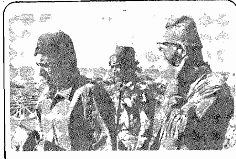
کمترین فایده انقلاب برای ما این بود که زورگوئی کارفرما کم شد. آینده‌ام روشن است!

حودم هم، با تخریب‌ها و متروحه‌ها، با او میرفتم. روزانه هفتاد تومان حقوق می‌گیرم و با این گران بزرور می‌توانیم زندگیمان را تا مین کنیم. درباره وضع زندگی پس از انقلاب می‌گویند: "قبل از انقلاب کارفرما زیاد آزارمان می‌داد، ولی از