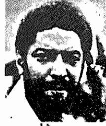
موریس بی‌شاپ نخست‌وزیر گرنادا

در زیر بخشی از سخنرانی موریس بی‌شاپ، نخست‌وزیر گرنادا، که در ۲۲ اسفند ۱۳۵۸، بمناسبت نخستین سالگرد انقلاب در سنت جورج، در برابر بیست هزار نفر از هم‌میهنان خود ایراد کرد، از نظر خوانندگان میگذرد: