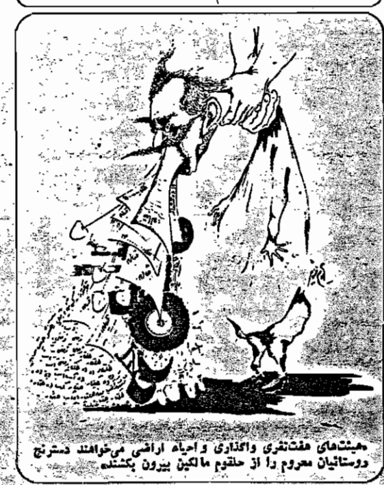
هیئت های هفت نفری واگذاری و احیای اراضی می خواهند دسترنج روستائیان معروم را از حلقوم مالکین بیرون بکشند