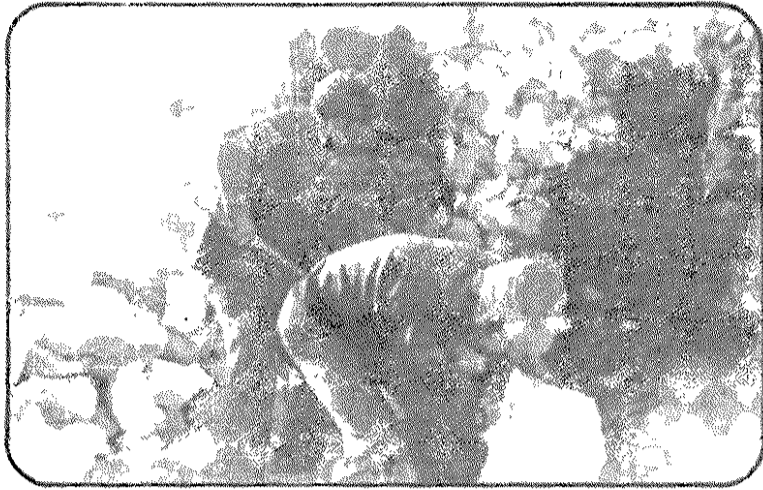
دشمن در کمین است، محرومیت‌های ما باور نکردنی است، ولی فعلا در درجه دوم اهمیت است.

تجاوز دارودسته صدام حسین به ایران بیش از پیش نقش عظیم طبقه کارگر را در امر حفظ انقلاب و دفاع از دستاوردهای آن برجسته می‌کند، زیرا بقول امام خمینی: انقلاب مال آنهاست و آنها بودند که انقلاب کردند و همان‌ها هستند که کمر همت به محر کلیه آثار امپریالیسم و ناپسودی وابستگی به امپریالیسم بسته‌اند.