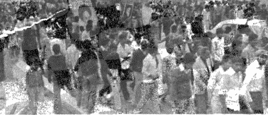
مراسم تشییع جنازه رفیق شهید علی تختی

رفیق شهید در بندرعباس بر- شانه های خلق تشییع شد. امواج خروشان مردم، پیکر گلگون رفیق علی را بر شانه توانای خویش، میبرد و در شمارهای خویش، خشم و نفرت را نثار دشمن اصلی میکند: - مرگ بر آمریکا! ریگان، ریگان، ننگت باد! صدام، صدام، مرگت باد! صف عظیم مردم، که پیشاپیش آنها تصویر رهبر انقلاب ریس از آن، عکس رفیق شهید، در قابی از گل، حمل میشد، شعار میداد: - برادر شهیدم، شهادت مبارک! برادر شهیدم، راهت ادامه دارد! جنازه رفیق شهید در میان غریب: - مرگ بر آمریکا! به خاک سیرده شد. و شهید دیگری از تبار توده ای ها به قله تاریخ رفت.