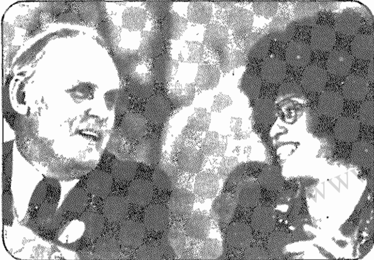
گس‌ها (دبیر کل حزب کمونیست ایالات متحده آمریکا) و آنجلادویوس (عضو کمیته مرکزی حزب کمونیست ایالات متحده آمریکا)

جامعه نو-نظام اجتماعی-اقتصادی جدید، که بر اساس مالکیت همگانی و مناسبات اجتماعی ناشی از آن استوار است و تضاد آشتی‌ناپذیر میان طبقات مخالف را از میان می‌برد - پایه عینی آگاهی سوسیالیستی را تشکیل می‌دهد. این نظام پیدایش