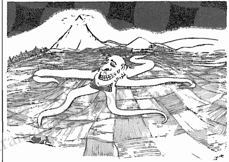
لایحه قانونی واگذاری اراضی را تمام و کمال و هر چه زودتر اجرا کنیم و ریشه غده سرطانی بزرگ مالکی را برکنیم

گزطوپله منطقه ایست عشا یر نشین، که در یکصد کیلومتری جنوب شرق داراب واقع شده است. وسعت این منطقه هزاران هکتار است، که در قسمت وسیعی از آن سفره آب زیرزمینی آن شور شده است، ولی در عین حال دارای بیش از هزار هکتار زمین مسطح و شیرین و قابل کشت است، که از سفره آب زیرزمینی مناسبی برخوردار است. در حال حاضر حدود ۳۰۰ خانوار در آن منطقه ساکن هستند، که حدود ۱۵ سال است ساکن یافته اند. حدود ۱۰۰ خانوار دیگر از همین عشا یر در حال آبیاب و ذهاب هستند. محل سکونت آنها را جاده های عشا یری تشکیل می دهد، آنها فاقد خانه های گلی، مدرسه، درمانگاه، آب آشامیدنی، حمام و غیره هستند. آنها می گفتند: "در زمان طاغوت ما حتی از این زمینها برای چرای دام هم نمیتوانستیم استفاده کنیم، بجز مساحت کوچکی از این زمینها، که اهالی میگویند زرخیدمان است و دیدم کاری میکنیم، بقیه اراضی هیچوقت کشت نشده است. بجز دو نفر، بقیه بیسواد هستند."