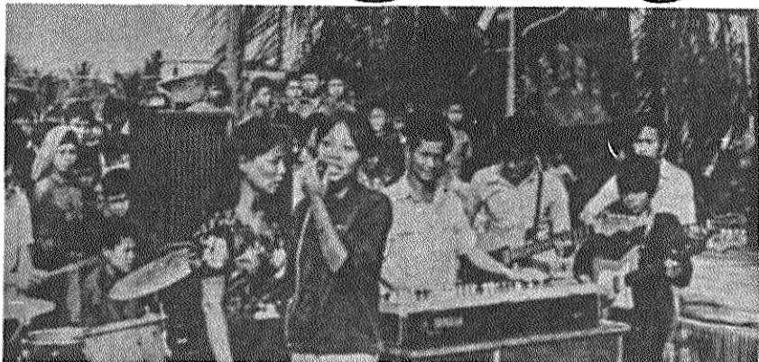
پنومپن: جشن تاسیس یک مدرسه تازه. بیشتر کودکان برای اولین بار به مدرسه میروند.

در ۱۷ دی ۱۳۵۸، «شورای انقلابی خلق کامپوچیا» قدرت را در کامپوچیا بدست گرفت. اینک با گذشت یکسال از سرنگونی رژیم خونبار پوپوت - ینگساری، که دزخیم ۳ میلیون انسان بی گناه بود، توسعه طلبان چینی، به دستگیری امپریالیسم آمریکا و دست نشاندهگان خود، توطئه ها و تحریکات تبلیغاتی و نظامی وسیعی را آغاز کرده اند. چین و آمریکا با حمایت از تحریکات مسلحانه تایلند، مسلح ساختن ضدانقلابیون و دامن زدن به هیاهوی تبلیغاتی درباره باصلاح تجاوز ویتنام، برای حفظ کرسی نمایندگان حکومت سرنگون شده پوپوت - ینگساری در سازمان ملل متحد تلاش می ورزند.