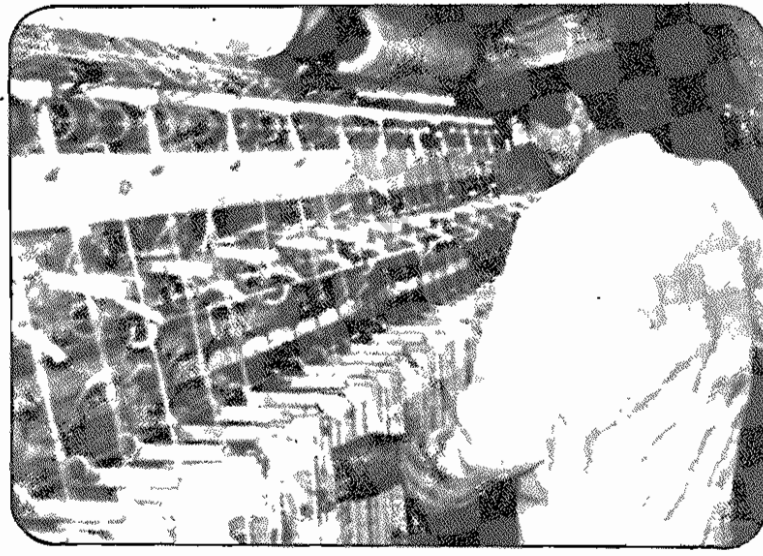
کارگران کارخانه ریسندگی پشم «هراز» آمل با کار و تولید بیشتر، با توطئه‌های آمریکا و عوامل داخلی مبارزه میکنند.

با بیست و سوزشکاران را طرد کنند. وظیفه ما اینست که جلوی احتکار را بگیریم و سعی کنیم تولید را با لایبریم و اضافه کاری کنیم. کم کاری و اعتصاب نکنیم چون بیکار ضربی‌ای به انقلاب است. اگر این انقلاب پیروز شود، برای ما رفاه خواهد آورد، و مهم‌تر از آن، مستقل و آزاد می‌شویم. دشمن اصلی انقلاب ایران آمریکا است. دوستان انقلاب نیز کشورهای هستند که نیازهای انقلاب ما را تامین می‌کنند و اعلام همبستگی کرده‌اند، مثل سوریه، لیبی و الجزایر.