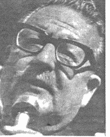
کک گرفته شده، زمینه اصلی را برگزیده است: فعالیت طبقات اجتماعی.

روزنامه ارگان بورژوازی وابسته، از همان روز پیروزی آئینده، علیه او به تحریک می‌پردازد. روزنامه‌های بورژوازی ضدانقلابی ججال می‌کنند