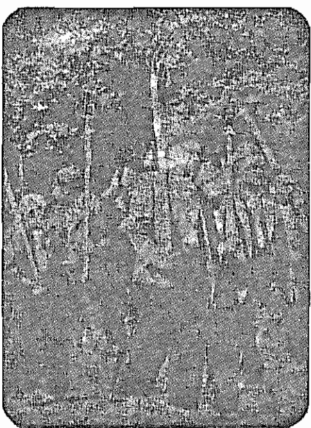
دهقانان مصمم‌اند با هروسيله‌ای از میهن انقلابی خود تا پای جان دفاع کنند: چه در سنگر، بادرهم کوفتن نظامیان متجاوز، چه در مزرعه با تولید هرچه بیشتر! (دهقانان اطراف اسفهان)

دهقانان چشم برآهند: هیئت‌های ۷ نفری باید هر چه زودتر وقایع تر کار واگذاری زمین