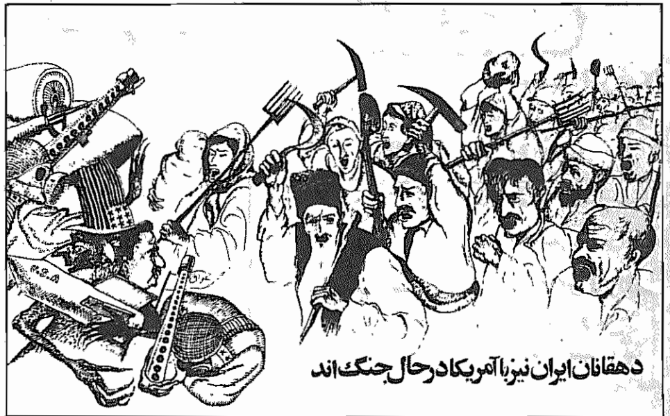
دهقانان ایران نیز با آمریکا در حال جنگ اند