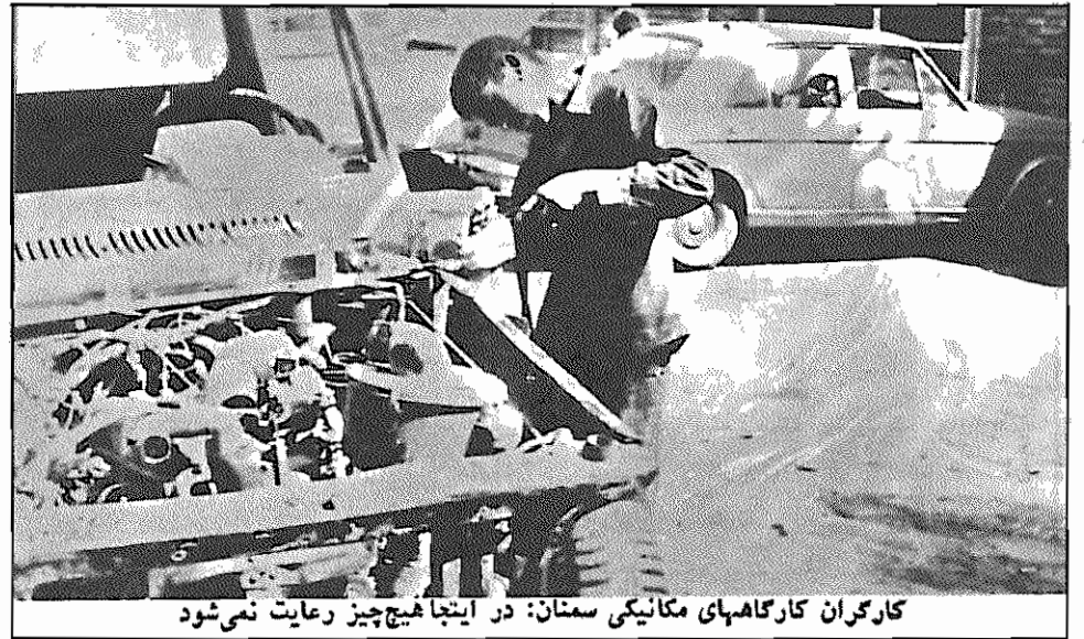
کارگران کارگاههای مکانیکی سمنان: در اینجا هیچ چیز رعایت نمی‌شود

در سمنان چندین کارگاه مکانیکی وجود دارد، تعداد کارگران این کارگاهها حداقل دو نفر و حداکثر هفت نفر است. در این کارگاهها قوانین کار رعایت نمی‌شود و اداره کار هم نسبت به آن بی‌توجه است. بسمه، بهداشت، دستمزد متناسب با کار، حداقل مسائلی است که باید رعایت شوند، ولی صاحب کارگاهها نسبت به این مسائل بی‌اعتنا هستند. ما برای آگاهی از وضع کار این کارگران به چند کارگاه تعمیر اتومبیل سر زدیم. یکی از کارگران در پاسخ سؤال ما که پرسیدیم: بسمه هستند، گفت: "نه. قانون کار شامل حال ما نمی‌شود. هر روز از ساعت هفت و نیم صبح سر کار حاضر می‌شویم و تا ساعت نه شب و بعضی اوقات حتی بیشتر از این ساعت کار می‌کنیم". از او پرسیدیم: جقدر مرد می‌گری؟ گفت: "هفته‌ای سی تومان. در بعضی از کارگاهها صاحبان کارگاهها به کارگران جوان خود دستمزدی پرداخت نمی‌کنند و به آنها می‌گویند: ابتدا باید مدتی کار کنید و هر وقت مهارت پیدا کردید، آن وقت به شما مزد می‌دهم". او در مورد وضع کارگاه از نظر بهداشتی گفت: "اینجا هیچ چیز رعایت نمی‌شود. سرو وضع مرا ببینید. توی روغن دست و پا می‌زنم. من باید پس از شامته کار حتماً دوش بگیرم، ولی در کارگاه ما آب لوله‌کشی نیست، که حتی بتوانم خودم را تمیز کنم. دستمزد منم آنقدر ناچیز است که نمی‌توانم بعد از کار حمام بروم". وارد تعمیرگاه دیگری شدیم. در آنجا کارگری که در حال کار روی یک فولکس واگن بود، وارد گفت: