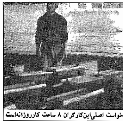
خواست اصلی این کارگران ۸ ساعت کار روزانه است

چندی پیش برای آگاهی اوضاع کاروندگی کارگران "بلوک رن" ایگودرز به میان آنها رفتیم و با آنها به گفتگو نشستیم. نخست پیرمردی که ساکت در کنار ما ایستاده بود، اینطور آغاز سخن کرد: