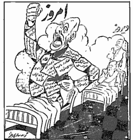
نقل از "ساهد"، ۲۰ اردیبهشت ۱۳۳۲

توجه کلیه مبارزان ضد امپریالیسم، به ویژه مسلمانان صدیق ضد امپریالیسم را به این سلسله مقالات جلب می‌کنیم