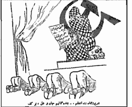
نقل از "ساهد"، ۵ مرداد ۱۳۳۲

آنتی کمونیسم، چنین دام مهلکی است. "ساهد"ها را نیک بنگرید که چگونه زیر لوای "ناسیونالیسم" و "اسلام" و آیات قرآن، زیر لوای حمایت از روحانیت و دسنامکونی به "کفروالحاد" جنبش ملی ایران را به مسلخ بردند و بنگرید که چگونه تاریخ گذشته در پیش حسان سما می‌گذرد، زیرا "ساهد"های امروزی، تحت لوای همان "ملیت‌پرستی"ها، "اسلام" خواهی‌ها، تحت لوای همان لفاظی‌های "انقلابی" نمایانه، میکوشند تا دیگر بار انقلاب ایران را خرد و نابود سازند.