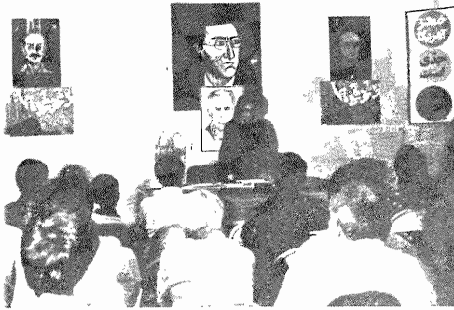
بزرگداشت روز تاریخی ۲۳ تیر در شهرستان مسجد سلیمان

چندی پیش کبیرتو ویدئیرا، در آستانه پنجاهمین سالگرد تأسیس حزب، در اعلام کرد که بزودی کنگره سیزدهم حزب کمونیسٹ کلمبیا فرا خوانده خواهد شد. مهم ترین وظیفه این کنگره آن خواهد بود که وحدت عمل طبقه کارگر را گسترش بخشد و شرایط تبدیل "جبهه دمکراتیک" را، که چند ماه پیش تشکیل شد، به یک جبهه وسیع ضد انحصاری و ضد فاشیستی فراهم آورد. حزب می گوید تا در مبارزه علیه