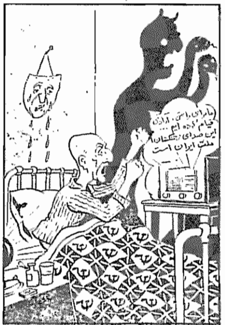
سئل ار "ساهد"، ۷ مرداد ۱۳۳۲

"ساهد" می‌نوست: "دولت آمریکا با انتشار این خبر خواسته است بدولترین مزبور (!)، بفهماند که دولت آمریکا از اسرار دوجانبه آنها با اطلاع است. یک منبع موثق (!) نیز اطلاع داده است که چنین مذاکراتی میان یک هیات انگلیسی که اخیرا به مسکو رفته، با مقامات شوروی وجود دانسته است و گویا دولت شوروی و انگللس که بعلت سیاست جدید دولت آمریکا در مورد چین، هر دو منافسان بخطر افتاده (!)، متفقا برای عقب نساندن آمریکا در صحنه سیاست آمریکا در صحنه ساسات خاور میانه، می‌خواهند اقدام به نسجم ایران نمایند (!)