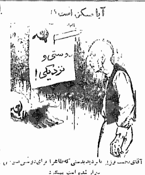
آقای زحمت‌پذیر، مبارز آزادی‌طلبی! مبارز آزادی‌طلبی!

هدف کارزار ایدئولوژیک و تبلیغاتی امپریالیست‌ها، سرگردانی مردم ایران از اهداف اصلی جنبش ملی شدن نفت و ایجاد شکاف بین مردم و دولت بود. آن‌ها سعی می‌کردند تا مردم را به فکر کردن در مورد آینده کشورشان ویناغبندی ویناغبندی در مورد مبارزه با امپریالیسم، ترغیب کنند.