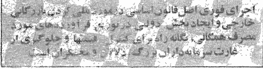
اجرای فوری اصل قانون اساسی در مورد حقوق و آزادی‌های شهروندان

خواسته است که سعی می‌کند از خصم و ناراضی‌ها بهره‌برداری کند. به دنبال اعتراض نا نوایان و طرح شکایت آنها در استانداری متروشد که آن‌ها فعلاً با نرخ قبلی نان بفروشند و از اعتماد بر هرگز کنند.