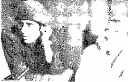
ما وظایف انقلابی خودمان را می‌دانیم...