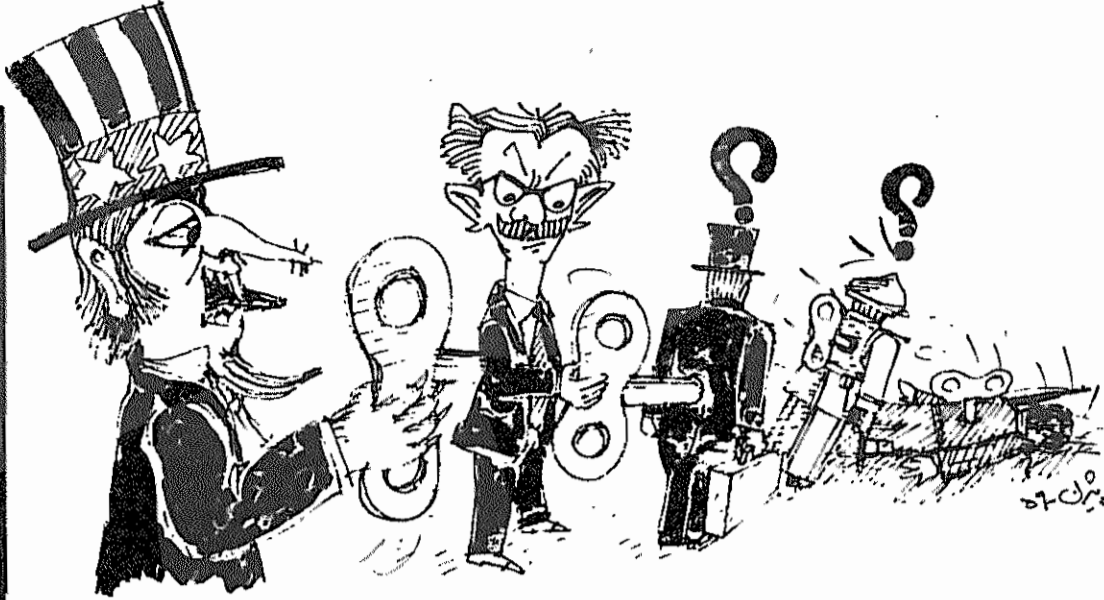
سراسر شبکه نظامی و سیاسی ضد انقلاب را باید نابود کرد

15 July 1980 Price: West-Germany 0.80 DM. France 2 fr. Austria 8 Sch. England 20 P. Belgium 10 fr. Italy 390 L. USA 20 Cts. Sweden 1.80 Skr.