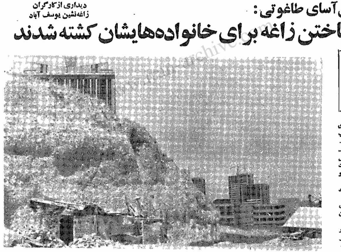
این زاغه را در سینه تپه پیمید، اینجا زاغه کارگری است که هنگام ساختنش آوار بپوش ریخت و کشته شد. در افق به آن آپارتمانهای غول آسا بنگرید و .....