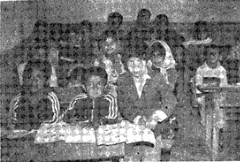
روستای سرکتساری: کودکان دهقانان تشنه آموختن و دانستن هستند