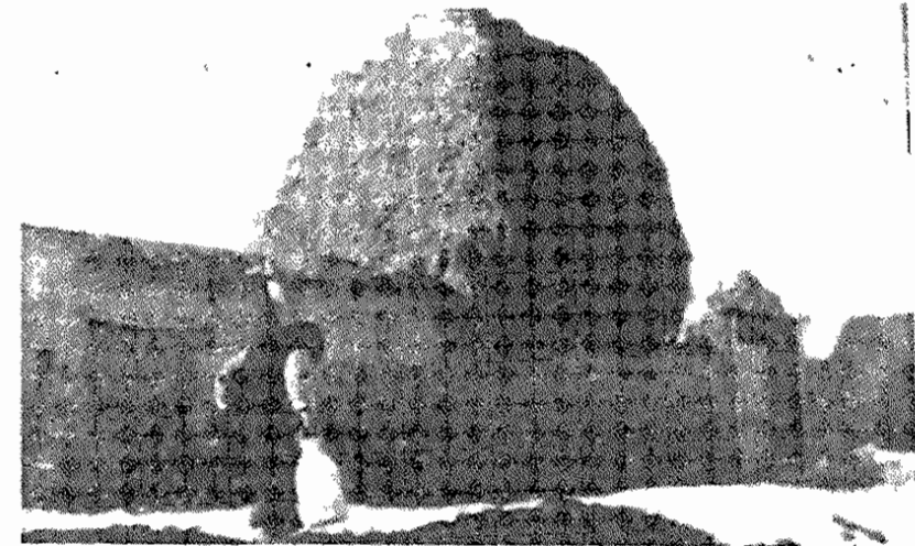
روستای اندرآب یکی دهقان ایرانی از زیر بار مشکلات کمراست خواهد کرد؟