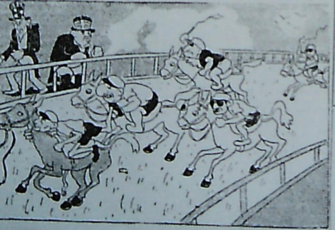
ساقه قدرت خیال این داستان روز به شب سازگاری مخالف دولت دست با تمام شبه تری زده و با اینگه سنا از دولت و معاون سراسر و سراسر به در صفحه ۷