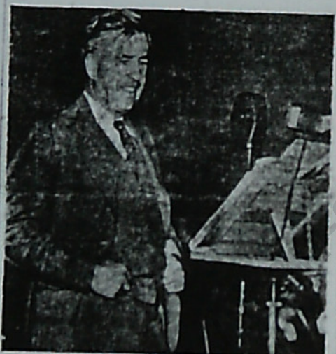
هنری و الاس بار و حشنگی با پذیر بار اتحاد امریکایی در حرکات است و او را نظری بر علیه از آن در زمانه بود که از آن کرد

« هوای لطیف بهار آمده را عاشق می کند! » و در وقتیکه بگذرد به بکن خیره میرشود دست سینه و پای تو آکام صورت و احاد اورای سینه وای معلوم نیست که چرا آفتاب ملک من در ستاره در این هوای لطیف بهار عاشق آفتاب پهلوی سانس ساخته اند و مثل این بر این چنان مستطاب کرده است که در این حوضه سرفرازی فلسطینی برده حزب توده ایران بوا با تسخیر خودشان دست و تکر گفار و روزنامه و با دیگران برایشان تپه و دهانه به در صفحه ۷