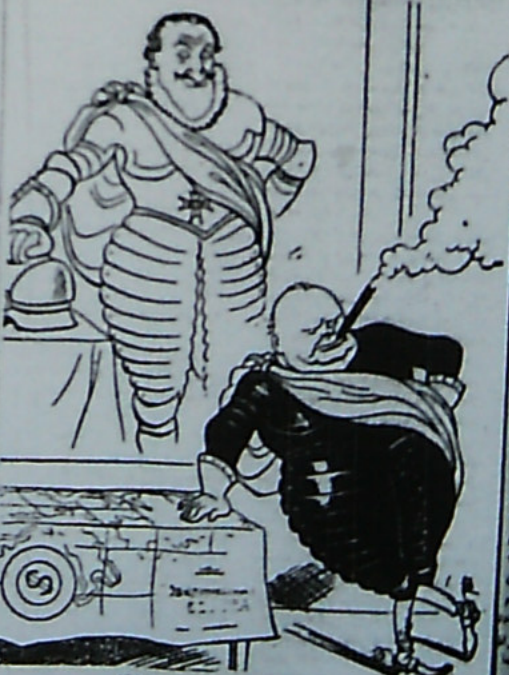
هاری دونو او و جریل دولار آقای حاشی و در شرح و زمانه سراسر اروپا را در تپه سراسر کرد ولی سراسر سوره بود تا با تپه حاشی جریل دولار هم مطبوع است به از از صفحه ۷

مستطاب فداکاره که اخیراً از طرف حکومت دیکتاتوری جرم می گردید مگر این در این بر موزان از حکومت دیکتاتوری سراسر می باید و سینه که ایجاد و به هم جریس سازه و بلافاصل آفتاب انقلاب و فعال روغن کند این ارتش پهلوی و روزنامه سرور آفتاب که با افکار مصممات و انگلیس منظر دیکتاتوری مدعی است که این همه باز و آزادی بر امان با اصول فلسطینی انکار مبارزه جبهه مطبوعات شد دیکتاتوری پهلوی تا مدتها با فلسطینی لرود و با تپه و تپه با تپه حسینی امان برای تلبیح مطبوعات آزادی لرود و با تپه و تپه با تپه و جبهه مطبوعات و معنی برای ایجاد ریش و مراغه و بلافاصله بر امداد و آری و آفتاب انقلاب و فعال می آید این ارتش و روزنامه اینگه با تپه نمود و اینگه روزنامه مبارز و آزادی فرمانده است همه سیاسی و فقهی اختلاف آری معنی دیکتاتوری پهلوی و از روی می آید و معنی دیکتاتوری و از جانب و فعال سراسر می آید و روزنامه