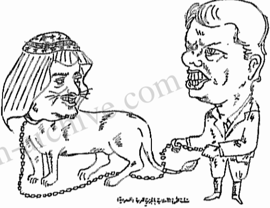
سازمان انقلاب اسلامی، حزب العرب (مربیان)