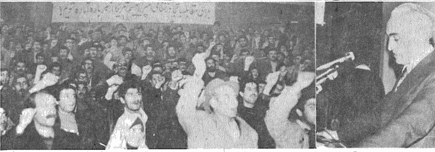
رفیق عبدالحسین آگاهی، عضو مشاور کمیته مرکزی حزب توده ایران در مراسم بزرگداشت ۳۳ افسر شهید در تبریز، سخن می‌گوید