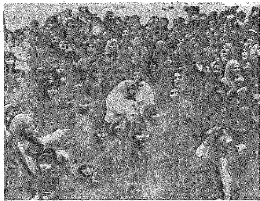
● صحنه ای از تظاهرات عظیم و فرور آفریننده ای، مقابل جاسوسخانه امریکا، تهران. ● زنان با کودکان خویش در آشوب آمده بودند تا از امام، رهبر انقلاب و از خط او دفاع کنند.

بدنبال حوادث پیریز تبریز، دیروز عدهای از هواداران حزب جمهوری خلق مسلمان که بهقه وچاقو وچاق مسلح بودند، با شماره بازار باید بنهند، در محوطه بازار، دست به تحریک و حادثه آفرینی زدند. اینان در بازارچه به هر مکانی که عکس امام خمینی را در دیوار نصب کرده بود، حمله ور شده و عکس را پاره میکردند. گروه دیگری از ایشان، در ساعت ۱۲:۳۰ در جلو میدان دانشسرا، راه را بر اتوموبیلها بسته و در پیشان شماره مرکب مدنی، (آیت الله مدنی، نماینده امام خمینی در تبریز است) می نوشتند. این عمل در خیابانهای دیگر نیز تکرار شد. یکی از اهالی شهر می گفت: ناراحتیم اینست که اینها همان شماری را میداندند که ساواک در ۲۹ بهمن سال ۵۶، در تبریز میباید (روز قیام مردم تبریز)، (عمامه دن تاج اولاد) خمینی دن شاه اولاد (عمامه تاج نمیشود، خمینی شاه نمیشود) عدهای از افراد حزب جمهوری خلق مسلمان می گفتند: «هر کس که ای که پشتیبانی خود را از امام اعلام نکند، باید منحل شود» اخبار رسیده حاکی از آنستکه حزب نامبرده به افرادی دستور داده که باید حمله وسیعی را تدارک ببینند تا شهر را در دست بگیرند. در مقابل دفتر حزب خلق مسلمان، سنگر بندی شده و افراد مسلح، پشت سنگر قرار دارند. یک بلندگو در جلو این دفتر به تبلیغات مشغول است. آنان غیر مستقیم به رهبر انقلاب توهین کرده و در فواصل منظم شماره مرکب بر موسی، غروی، خلخال، (حجت الاسلام موسی، رئیس دادگاه انقلاب تبریز و آقای غروی استناد آذربایجان شرقی هستند) میدادند.