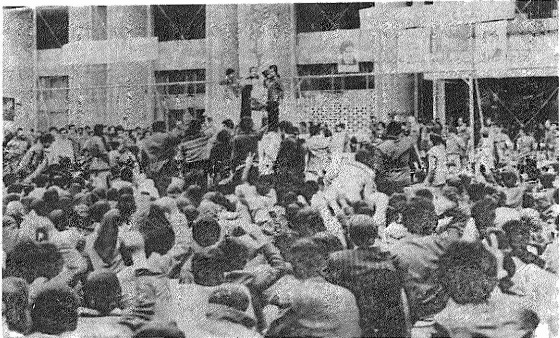
گوشه ای از مراسم پانزدهمین سالگرد انقلاب فلسطین در زمین چمن دانشگاه تهران

حزب طراز نوین طبقه کارگر ایران! گروهی از هواداران سابق سازمان چریکهای فدائی خلق در بابل