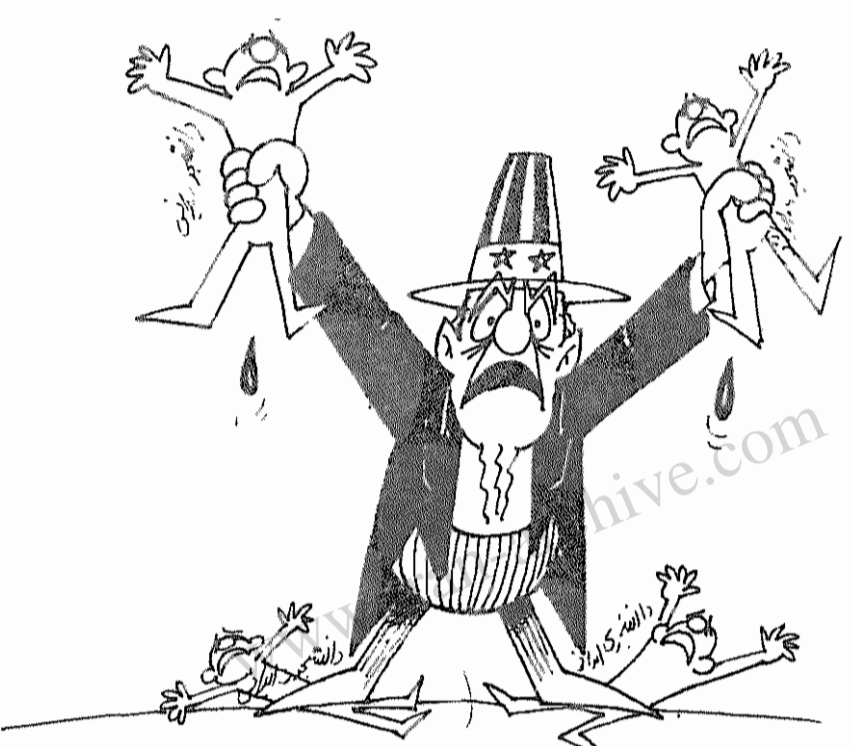
عموسام - ایران مسئول نقض حقوق بشر و دموکراتیکه!! انقلاب اسلامی - ۲۴ آذر