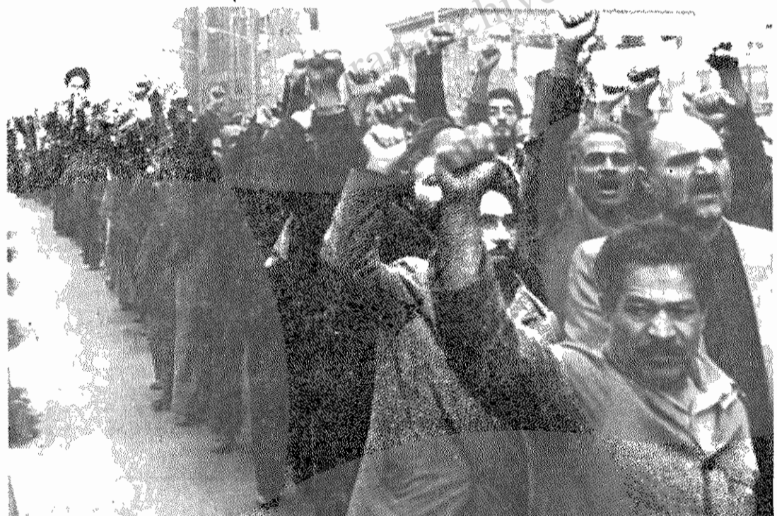
راه پیمائی دیروز بر ضد «خبر گزاریهای صهیونیستی»

راه پیمایان سکوت کرده بودند. آنها می‌گفتند برای این سکوت کرده ایم که خبر گزاریهای امپریالیستی - صهیونیستی حتی شعارهای ما را هم تحریف می‌کنند