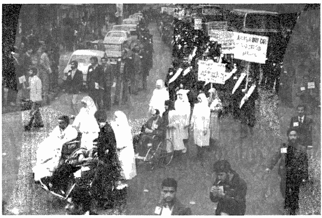
راه پیمایی دیروز بر ضد مطبوعات و خبرگزارهای امپریالیستی، توأم با پلاکاردهایی به زبانهای خارجی و نمایانگر نظم انقلابی چشمگیر شرکت کنندگان بود

۲۰- از کلیه شخصیتها و مسئولان در تمام نقاط کشور خواهانیم که از مواجحه با خبرگزارهای صهیونیستی و ضد انقلابی، که جهت آنها منافع حساسیت مردم مسلمان این مرز و بوم است. جسداً خودداری کرده و در غیر این صورت موضع غیر اسلامی و غیر انقلابی و غیر مردمی آنها برای مردم ما روشن خواهد شد.