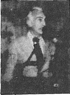
رفیق عبدالحسین آگاهی، عضو مشاور کمیته مرکزی حزب توده ایران، در حال سخنرانی

رفیق عبدالحسین آگاهی، عضو مشاور کمیته مرکزی حزب توده ایران گفت: جنبش دانشجویی بخشی ناگسستی از جنبش رهایی بخش ضدامپریالیستی ودمکراتیک مردم ایران است.