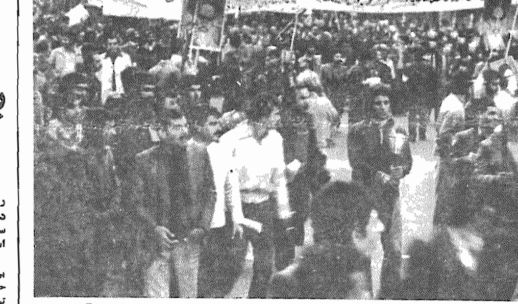
سینماگران، همراه خلق، بر ضد امپریالیسم آمریکا

انقلاب ما اینک در دو جبهه به نبردی سخت مشغول است، نبردی که بر غم تلاش‌های شبانه‌روزی حریفان شکست نمی‌شناسد و به