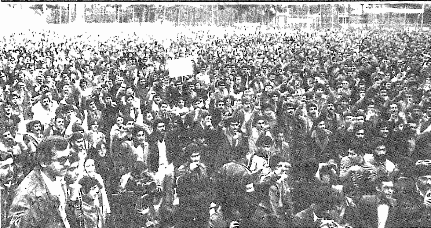
جوانان و دانشجویان دمکرات ایران آمادگی خود را برای ادامه مبارزه تاپیروزی قطعی و نهایی بر امپریالیسم آمریکا اعلام داشتند

مقابل لانه جاسوسی می رسند، غروب شده است. در سایه روشن غروب، اینجا و آنجا، شعله ای نارنجی از سوختن ترسک های شاه مخلوع و آرایش روز را باز میگردد و اینک این شعار آتشین: «زنده باد جنبه متحد خلق ما علیه امپریالیسم» در خود جای میدهد. دست کلبه های سازمان جوانان و دانشجویان دمکرات