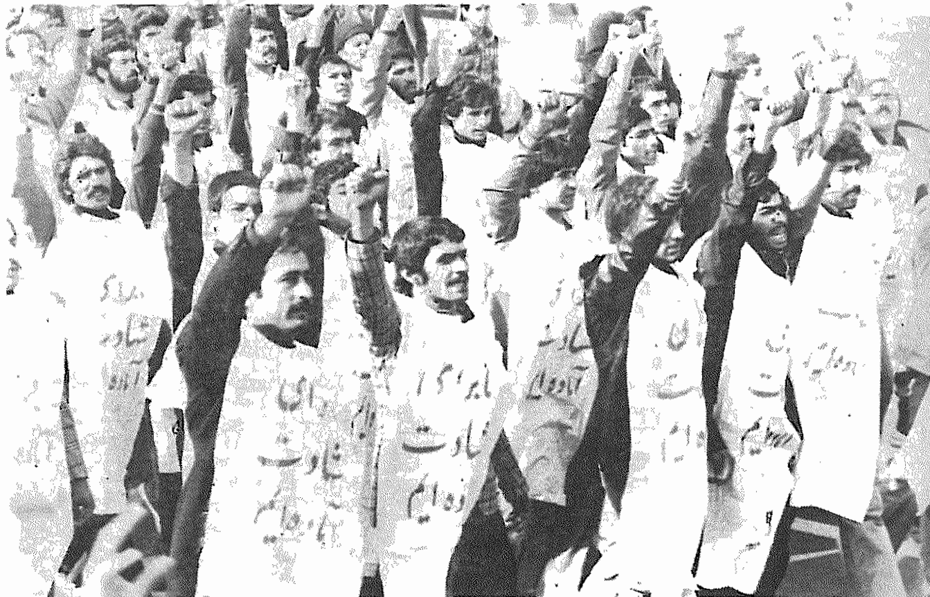
مردم قهرمان محله چارمردان قم، کفن پوشان، آمادگی خود را برای شهادت در مبارزه علیه امریکا اعلام داشتند.

مردم محله چارمردان قم، که شرح دلآوری آنها از مرزهای ایران گذشته است، در یک راه پیمالی باشکوه از دانشجویان مسلمان پیرو خط امام پشتیبانی و آمریکا را محکوم کردند.