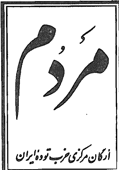
ازگان مرکزی حزب توده ایران

بعضی‌ها می‌خواهند بجای «وابستگی به امپریالیسم» که یک مفهوم اجتماعی است «وابستگی به غرب» را که یک مفهوم جنرفیائی است قرار دهند!