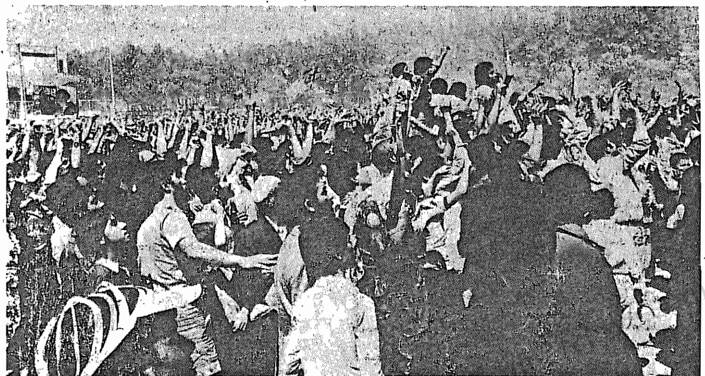
صحنه‌ای از تظاهرات روز قدس

اطلاعیه دبیرخانه کمیته مرکزی حزب توده ایران مسئله کردستان باید در چارچوب دفاع از انقلاب ایران و تضمین حقوق ملی خلق کرد حل شود