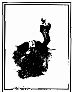
تندیس بنیاد خسرو روزبه، اثر هنرمند متری رضا اولیاء، در شهر قیاقوروماو (در نزدیکی روم، پایتخت ایتالیا)

و عضو این سازمان هستند این سازمان همچنین دستمای بی نام و نشان، با امضای «گروه یاران روزبه» و