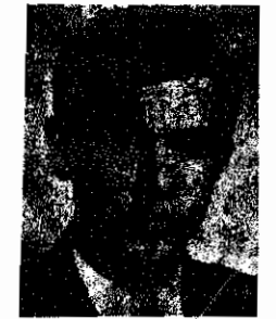
شهید مهدی رضائی

در دفتر یادبود نمایشگاه، نوشته های از جانب بازدیدکنندگان دیده می شود که حاکی از حق شناسی نسبت به شهیدان و همچنین عزم راسخ برای ادامه راه شهیدان است. از آنچه که تاکنون نوشته شده، ساده ترین و کوتاه ترین و درمیان حال پر ستاینه آن ها، با امضای «یک برادر مسلمان» است که نوشته: یاد خسرو روزبه گرمی باد.