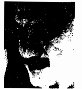
شهید پرویز حکمتجو

و مدارس مادرهای زجر کشیده، ما مادران شب و روز دعا کردیم، ناله کردیم و در داغ عزیزانمان صبح زدم به یاد می بردیم. داغ دشمنان خلق بمسرای اعمال ننگینشان برسند. ما دعای خود وجود مبارک هستیم، به درد دل ما صوفی فرمایید. به درد دل کسانی که جگر صوفیهایشان زیر شکنجه های وحشتناک جان دادند و فریاد زندان زنده باد ملت قهرمان ایران.