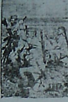
سربان خیار در عراق... (Caption describing the image content)

بهر جهت انیام ۲۳ لشکر آلبانی و یک سووم از است امکان در مقدماتی از لشکرهای مجبور دور رسامه موسیان شد که در قفس موردا در جای دیگر در معالی گمانا نقش توده بیرو غرضی نسبت بوی وارد آمد. آنگون می بیند که جت دو دو انکور الجزیره و مراکش پایان یافته و شاید روزی اردی در تونس و این بر پایش پیروز و آسود است صبه ایمن سواحل جنوبی اروپای اشدلی مورد تهمینه و واقف شود. ۴. روابط انگلستان با کشور اتحاد جماهیر شوروی است که چون با نظر ما اعجاب زبانی در فرسارد و باطل معادله های تشریح آن خواهیم پرداخت.