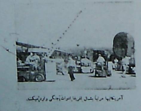
آمریکاییان مرتباً شش افریقا ادوات آبسک و اورد بیکت... (Caption describing the image content)