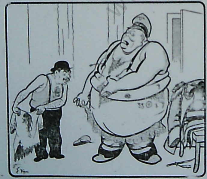
گوی رنگ - بدی است که من، دستار فزان هم تم، گرز گلایتم فرانسی را با استقبال بگردم

آیه در این حملات ۳۰۰ هواپیمایش است نوده و چهار بجم کارخانجات در مورد کلا شراحت گردید، علاوه بر این اعلامات رسمی قول دادند که دیگر کارگر بکار خواهند بود. پس از آن ضربهای سختی بکارخانجات اسن دکلی، اوتوب، وستونک لو کسپورت زده شد. یک حمله سختی بر علیه کارخانجات طیاره سازی هیکل حمل آمد، فاشی که هشتصد سرباز و یک کارخانجات بود، دو صده ۳