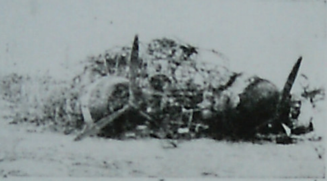
هواپیماهای ایتالیایی که ضربت گرفت حلیان افریقای جنوبی تاجات نشسته اند