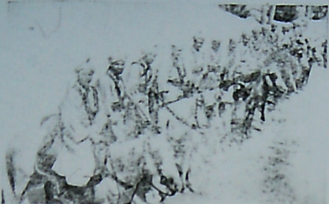
این جبهان غرب پس از شکست فرانسه به ژنرال دو مئل میومند تاجات را برقیه بازها ادامه دهد

که زمانه انان شوروی کرده و نوبلی که زمانه انان انگلیس و آمریکایمانه جل این مسئله خارج باستان پیش از دو عالم طول انحصار پایه گردن نیرو باستانی باغیان - کندی شده ای تمام باشد و چون شک در طرف نگروز سوزانجا و با سرباز آید دو جنس و خدمت مشکلی نگرفته پایه گردن فرماندهی آن فلاجه عطفه حساس را در خطر نگارد و پس از پایه گردن نیرو در آن عطف و جانب توجه داشتن عطف دیگری مورد محرم و وقت نگردد بطوریکه غریبا این عطفه به تاکیاتک این در محرم دور خواهد بود ممکن است مازاد خودمان سوال کنیم که این عطف حساس در مقام گنود باغی نیرو خواهد آمد. پاسخ همین جواب از عطفه ما خارج است لیکن باستانی متذکر شد که عطفین با روابط باستانی که اکنون باستانی و بر تامل دارند گمان نبرود. در تازه جزیره آبی نیرو داشته بود. سوامین بروز نیز لولا گنود را انجمن معاصر است و دنیا نیروی آلمانی تا اکنون در آنجا با باستانگانی نیز دست زده است و در ضمن چون توده باستانی از مردمان آسیر اروپا در فرانسه و بلژیک بر سر میانه بین یونانین گنک می باشد و در آنجا در اروپا و اروپا در آنجا در سوامین که از جمله دوم آنها در سوامین فرانسه و بلژیک است. خواهش شد. با این عطف که در آنجا سوامین چنین عطف زده که عطف حساس اولیه سوامین بلژیک و فرانسه حاضر است عطفه باستانی و بلژیک و سوامین است. با این عطف که در آنجا سوامین در آنجا در سوامین که از جمله دوم آنها در سوامین فرانسه و بلژیک است. خواهش شد. با این عطف که در آنجا سوامین چنین عطف زده که عطف حساس اولیه سوامین بلژیک و فرانسه حاضر است عطفه باستانی و بلژیک و سوامین است. با این عطف که در آنجا سوامین در آنجا در سوامین که از جمله دوم آنها در سوامین فرانسه و بلژیک است. خواهش شد.