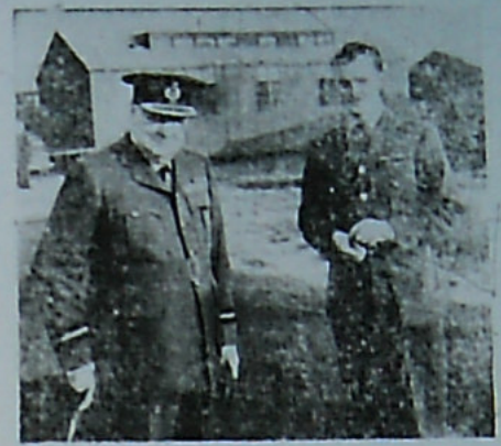
مستر ویستون چرچیل در جامه فرماندهان نیروی هوایی با فرمانده گروه هوایی ۶۱۵