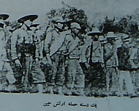
پک دست حله ارتش چین

فرمان دیکتاتوری یکی علت تاثیر سوکت خارجی و دیگر حلت اینکه پیش ازین با شرایط اجتماعی تسلیم میکرد پایانبسته بود و مشروطیت آغاز شد. عقل این تعبیرات متوالی صرف نظر از جز اقتصادی و اجتماعی عدم پرورش روحی توده برای ایجاد و حفظ و ترقی دموکراسی بوده است اما تصور میکنیم این عامل خصلتک امروز نیز در روحه مردم ایران موجود است و تا این روحیه باقی است هر آنگه حفظ استقلال آزادی و هویت از اجتماع وجود دارد. پس یکی از شرایط حفظ و تکامل دموکراسی معنی پرورش روح آزادیخواهی در توده مردم است.