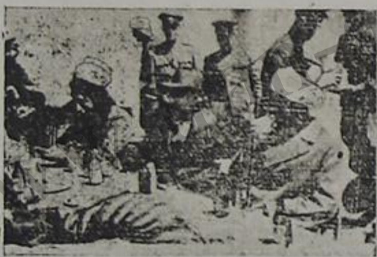
آقای بیشه وری و آقای غازی محمد مانووردان صورلا جولده ترتیب وئریش ایشکلی عیزینین باشیندا

مملکت خبرلری تبریزده فردوسی سالونوندا تعایش صنعت مدرسه سینن ادبی انجمنی نین آچیشی مناسبتله، آقای برادران طباطبائی نین گوسر- یشیه صنعت مدرسه سی محصل لر ی طرفینده (سلطان محمود غزنوی) و بیر پرده لیکه (کدو تاجر ی) آیدندا ییملر حاضر لاس آیین ۱۳ و ۱۵ ینده مدرسه خاگرد لرینه و آیین ۱۶ سنندا هیئت دولت و تبریز شبالیلاری ایچون نناش ویرایشدر. هله برده آچیلماشندان قاباق صنعت مدرسه سینن مدیری آقای هندیس جواد الاشی تاشاچیلار ا عرض تشکر ایدندن صور اسنت مدرسه سینن ۱۱ ایلیک تاریخیچه سنندن مختصر وجهیله صحبت ایدیلر، ساعت ۴ یاریندا نناش باشلادی. محصلر نوز روللارینی موقیفته اویناد یلاریندان دهفرله تاشاچیلار طرفیندن آلفیشلایردیلار قید ایشک اولار که، صنعت مدرسه