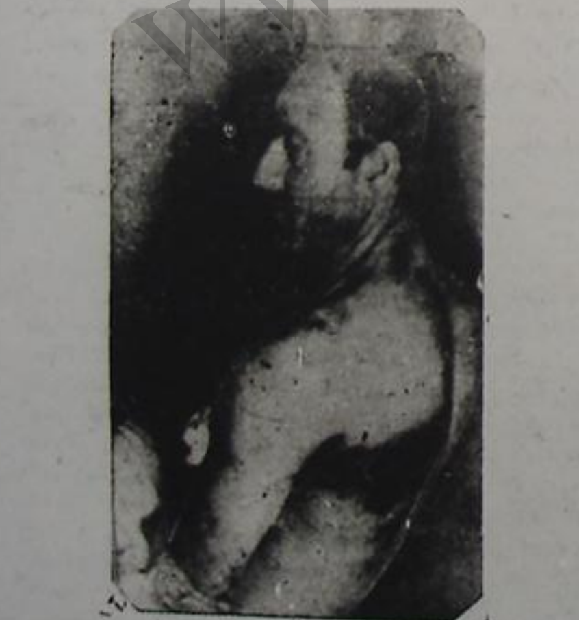
ساورایف داوود فخر ۳۰ جولله ایله بارالانمیشدر محاکمه نین ایکنچر جومسی پنجه نینه گونی ساعت ۳ گون اورتادان سونرا ح . علی اوغلی

اول صفحه دن قیه ژنرال پناهان محکمه نی آجیق اعلان ایدب نظم و آراملیگی گوزم . تلمت ایچون تماشاچیلارا تذکر وزدی . اوندان سونرا مته لره چوق آزاد بیر شائطده اوزلرینده دفع ایتیمت آخزمسی و یلدی سرهنگ زنگنه سرهنگ میلانیانین قاضی لرین جریمنده اولدیلر اعراف ایتدیگی ایچون سرهنگ میلانیان محکمه نین عضو سیندن استعفا ویردی باش مدعی العموم نوز ادعایه سینیه فرات ایدی . ادعایه اوخون زمان خلقد درین بر هیجان او نامیش ایدی . مدعی العموم آذربایجان جامه سی و خلقی آدنا گناه زارومیه اهالیسینی قله تبه نلرین جراسینی طلب ایدریدی بو ادعایه خلقیمیزین اراده سی ، آرزو سی ایدی . شاهدلردن آزاد وطن ، سرهنگ داروغه ، سابق ارومیه رئیس نظم سی ، بیرفر تماشاچیلار دان که نوزی ارومیه فاجعه سینده واراش ، و ان دادور ارومیه پادگانه ندا بیر گردان فرماندهی قلی ایشه که شخصاً ترور ایتدیگیم . در نوز محاکمه سینده اعدام جزاسینا محکوم اولمیشدر ، دانیشدیله . محکمه و مدعی العموم طرفیندن مته لردن لازمی شواللار اولوندی مته لر : زلریندن دفاع ایدیلر . بو محکمه ده دو کراسی تم معاشی ایله نظاهر ایدریدی ، شهر اهالیسین چوغلی برنجی دغه اولاراق بوملی محکمه نین شاهی اولدیلار بو محکمه ده خلق ط فیتدن نظم تاپیایه رعایت اولدی و بو گونستر بردی که خلقیمیز بو بوک بیر انضباط روحیه ، عالی بیر تربیه مالکدرلر محکمه فور تادیلدن سونرا