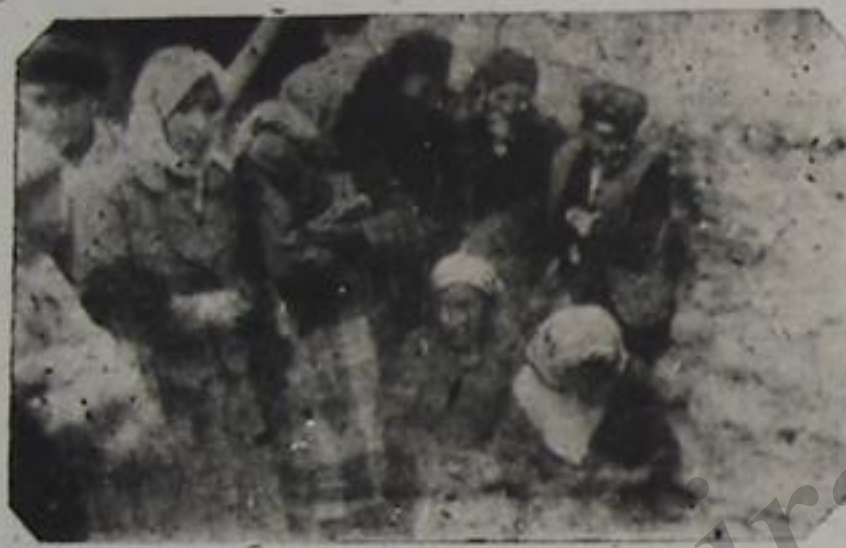
۳۰ ژانویه ۱۹۴۶ ده ذو آیین ۲۵ نده اولدیریلنلر ایچون آوهولاریندان غلامین لاریدار بیرده