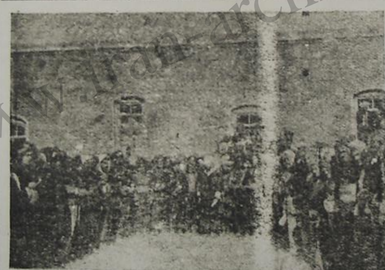
کردستان دمکرات فرقهسینی تشکیل ویرلردن مهاباددا گرد طایفه لرینین رئیسی و نماینده لری

شله جنده یوک فداکارلیقلار لازمدر اولان بور کورنیدن هر دقیقه مین لرله اولدی آهالار، نالعلر آسمانا چکیردی. بو ظالم خلقین قانینی سوروب ملت، باشی کسلیمش توپوق کیمی چا بالییردسا، اولار اوز کیلرینه مشغول اولوب، هله بو مدنیت خانن لری ملتین آلتی تری ایله عمله گلمیچسکینی سن لیکنرده و فونالفلرده اوز شهوتلرینی سوندورسگ صرف ایتسگدن باشقا، اولکه نین صاحبی اولان خلقی خلقی استهزا و تمسخر ایتسهدیلر. اولار ییله ییلردیلر که خلق ایشلمک ایچون و اولار دا زحمتسیرجه سینه خلقین امگی ایله خوشگذراناق ایتسگ ایچون دیایه گلبیدرلر...!