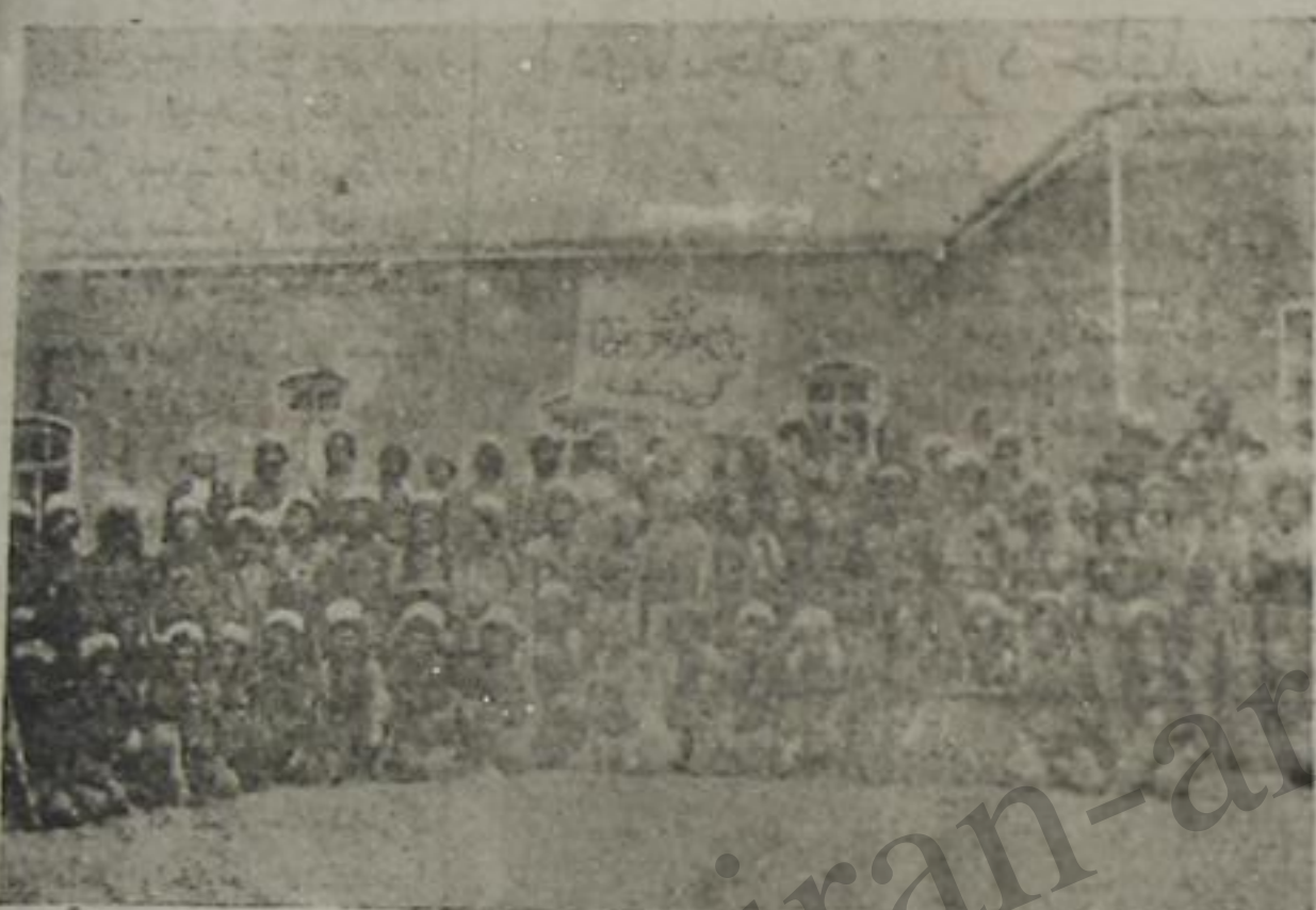
گردستان دمکرات فرقه سین نماینده لریندن آیری یر منظره