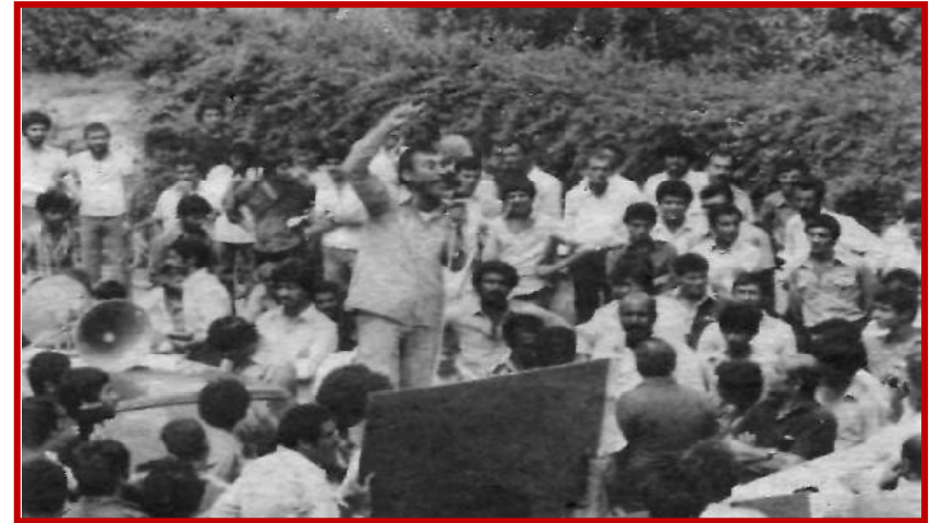
سندیکی کارگران پروژه ای و فصلی آبادان و حومه

زمانی که رژیم ارتجاعی جمهوری اسلامی با زد و بند تاریخی پشت پرده با قدرتهای امپریالیستی و تحت شعار مزورانه و ریاکارانه "همه باهم" حکومت را در دست گرفت مهمترین وظیفه اش حفظ و بازسازی ماشین دولتی نظم قدیم از جمله موسسات و طرحها و پروژه های نیمه تمام تاسیسات صنعتی بود که در واقع حول منافع مشترک امپریالیسم و رژیم وابسته پهلوی ساخته می شد. رژیم پهلوی به عنوان همکار و حافظ منافع امپریالیسم جهانی خاصه آمریکا بود. این رژیم مدیر داخلی پیشبرد راهکارها و برنامه های دزدان و غارتگران جهانی بود. در واقع تامین و گسترش کلیه منافع نظام اقتصادی سیاسی و ایدئولوژیک سرمایه داری - امپریالیستی در ایران از طریق این رژیم به پیش برده می شد. و ایران در کلیه شئون اجتماعی، اقتصادی، سیاسی،