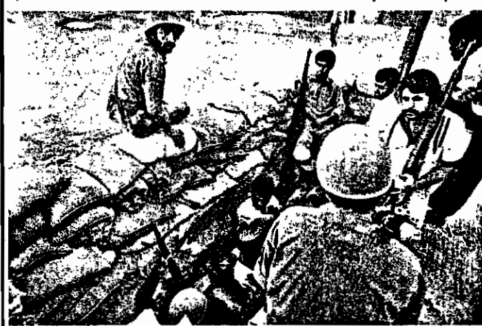
یک سنگر خیابانی - جوانان، پاسداران، سربازان، چون تن واحد آماده رزم و شهادت در راه انقلاب و جمهوری اسلامی ایرانند.

* هوای ماها و تو بیخانه رژیم جنایتکار صدام حسین محلات زحمتکش تشین را مورد حمله قرار داده‌اند. * جوانی در سنگر گفت: امریکای کثیف بدانند که ما تا آخرین قطره خونمان در سنگر خواهیم ماند. * یک پسر بچه ۱۲ ساله تفنگک بدست، تا صبح پاسداری داد و مدام شعار میداد: مرگت بر آمریکا! * زحمتکشان اهواز: ما خانه‌ها را خالی نمی‌کنیم. می‌مانیم و می‌جنگیم تا بیروز شویم. صحنه ۴