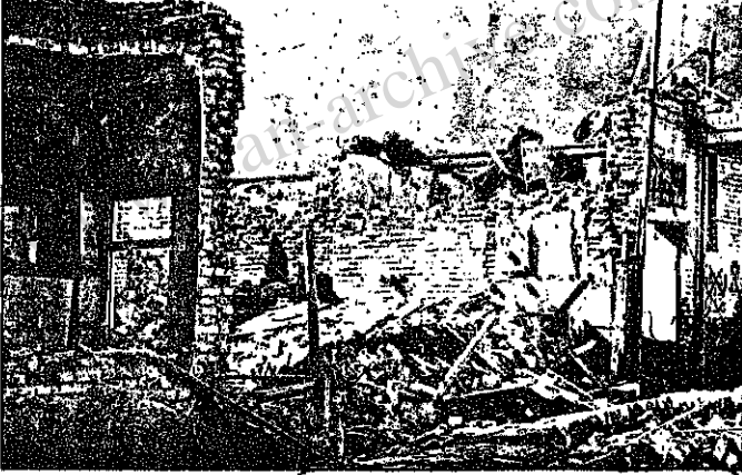
تجاوزکنان صدامی خانه‌های زحمتکشان را هدف گرفته‌اند

در یکی از کوه‌های همین محله، مأموران برق سرعت مشغول تعمیر سیم‌های برق هستند و کامل -