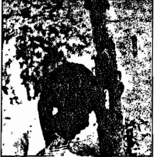
پارک آزادی شیراز - کارگر جوانی که از فرط خستگی به سایه درخت پناه برده است، از گوش چرم می‌مد، ولی مجبور است کار کند.

فعالیت‌های این کارخانه نمونه‌ای است از کار مفید شوراها در بهبود وضع کار و تولید، البته شورا باید بتواند هماهنگی موجود بین کارگران هیئت مدیره را ایجاد کند و در ارتباط با سندیکای خود باشد، تا بتواند کمبودها و نارسایی‌های موجود را بدین وسیله جبران کند.