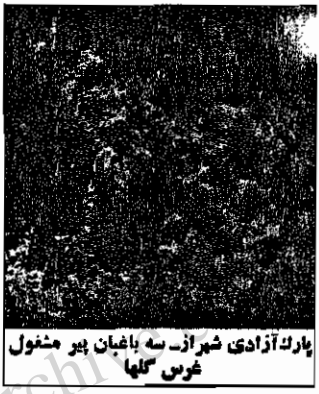
پارک آزادی شیراز سه باغبان پر مشغول غرس گلها

در پارک آزادی حدود چهل نفر به شغل باغبانی اشتغال دارند، که بیشتر آنها از زمان افتتاح پارک در این جا کار می‌کنند. در میان آنها کارگرانی یافت می‌شوند که بیش از هشت سال سن دارند. این کارگران باید تا آخر عمر کار کنند، زیرا حقوق ناچیز و زشتی، به هیچ وجه کفاف زندگی آنها را نمی‌دهد. یکی از کارگران باغبان، درحالی که از گوش چرم می‌مد و به علت ضعف روی خاک و گل ولای زبردستی دراز کشیده بود، گفت: