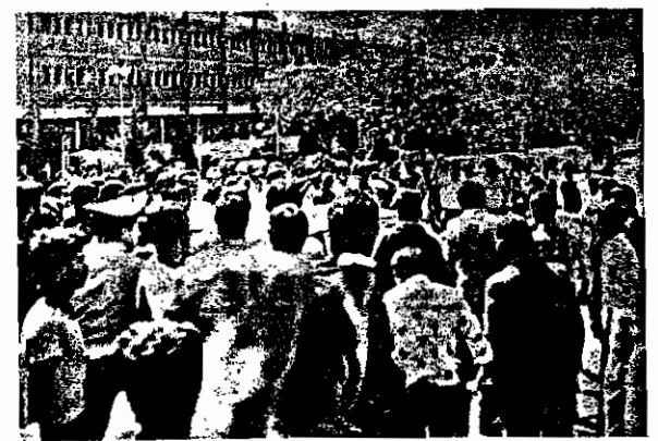
مردم خطاب به ضیاء الحق: هرگ بر آمریکا هرگ بر دیکتاتور

مردم مبارز تهران، ضیاء الحق را از نمایشگاه بین المللی بیرون کردند! حاضرین در نمایشگاه با مشاهده ضیاء الحق فریاد زدند: هرگ برژینسکی، هرگ بر آمریکا!