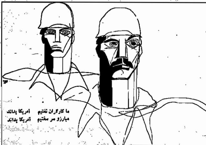
ما کارگران نفتیم آمریکا بداند مبارز سر مستقیم آمریکا بداند