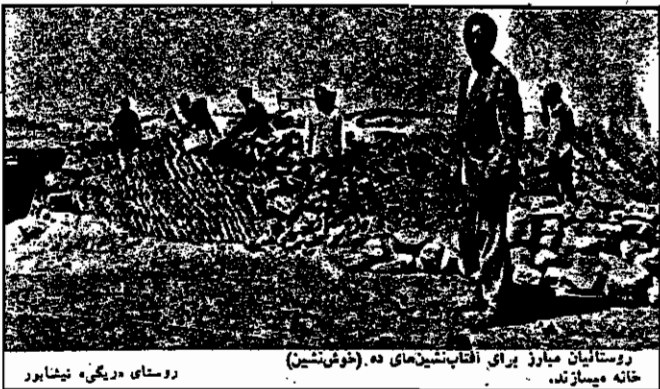
روستاییان میاور برای آفتابشینی‌های ده (خوش‌نشین) خانه میسازند.

ولی چون وام ناپدید دولت، کفاف پرداخت پول بیمانکناری نمی‌کند، عوامل پیمانکاران پستی‌های زمین خونخوار پهلوی، موتور چاه عمیق درحال بهره‌برداری را بخاطر عدم پرداخت هفت هزار تومان بدهی کشاورزان متصرف می‌فروشند و آن را به فروش می‌رسانند. این عمل باعث از بین رفتن کشاورزی و خرید شدن دهقانان ریگی می‌گردد. شرکای چاه عمیق، که ۱۳۵ نفر از روستاییان، یعنی تقریباً تمام اهالی ده را تشکیل می‌دادند، اغلب مجبور به مهاجرت به شهرهای اطراف و تهران برای کارگری می‌شوند. هنوز این چاه به راه نیفتاده است و تلاش‌های اهالی ده و به خصوص ۴ نفر از نمایندگان اهالی روستا به جایی نرسیده است.