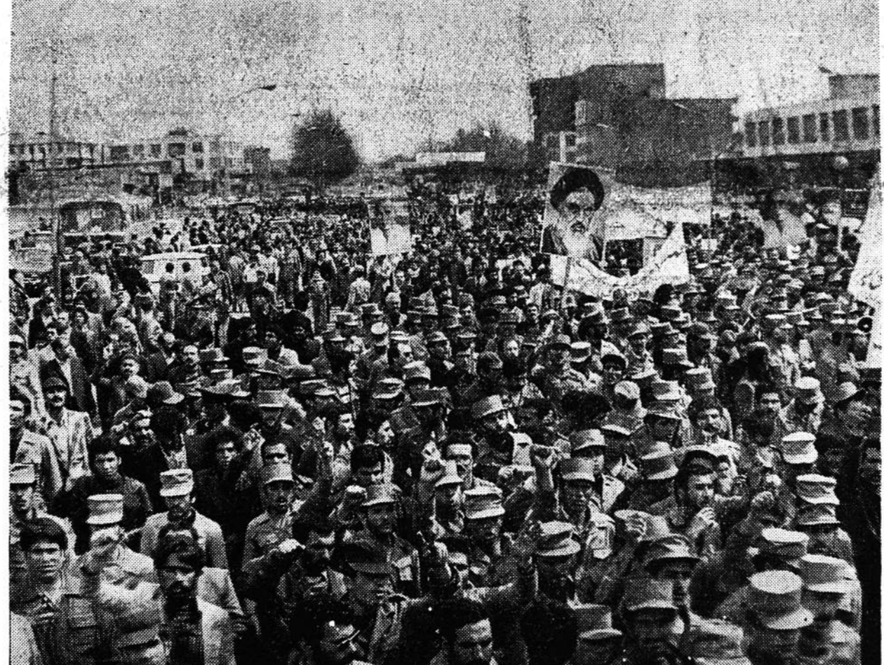
دیروز نیرو های مسلح در تهران و شهرستان هاراهیمائی کردند و در حالیکه پلاکاردهائی همراه داشتند بار دیگر همبستگی خود را با انقلاب اعلام داشتند. عکس گوشه ای از راهپیمائی را تنها در یکی از خیابان های تهران نشان می دهد.

آدرس جدید مجله امید ایران سمعی شمالی ساختمان آکمی زیبا پلاک ۲۵۵ تلفن های ۲۱۷۴۸ - ۲۹۲۶۰۸ (بقیه در صفحه ۲)