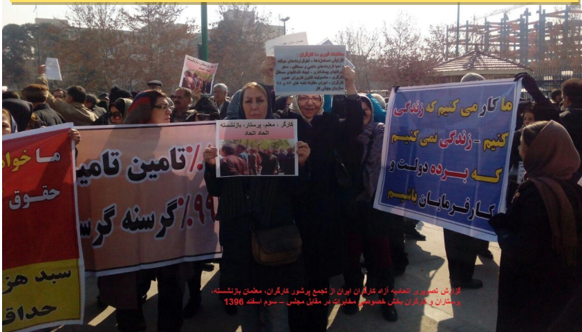
گزارش تصویری و تهیه از راه کارگران ایران از تجمع پرشور کارگران، معلمان بازنشسته، پرستاران و کارگران بخش خصوصی مخابرات در مقابل مجلس - سوم اسفند ۱۳۹۵

تجمع پرشور کارگران، معلمان بازنشسته، پرستاران و کارگران بخش خصوصی مخابرات در مقابل مجلس - سوم اسفند ۱۳۹۵