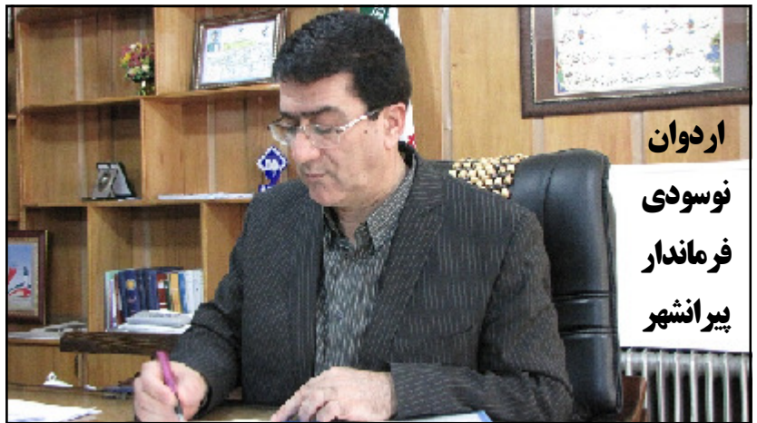
اردوان نوسودی فرماندار پیرانشهر