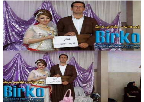
زندگی جاریست... همدلی عروس و داماد سندجی و روانسری در حمایت از سنگال و کوبانی