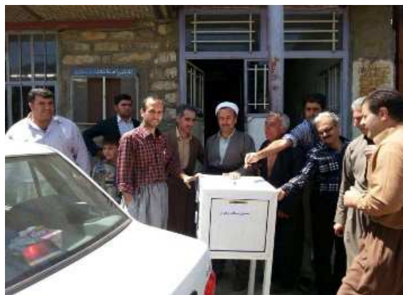
حمایت روستاییان کامیاران از مردم سنگال