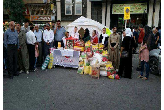
زندگی جاریست... همدلی عروس و داماد سردشتی در حمایت از سنگال و کوبانی