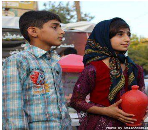
سردشت هم نوا با ناله های سنگال و کوبانیانجمن حمایت از