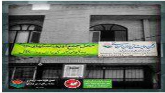
یک خواهر و برادر فولک خود را به کودکان سنگال هدیه دادند