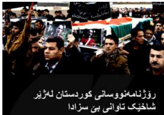
روزنامه‌نویسانی کوردستان له‌ژبیر شاخیک تاوانی بی سزادا