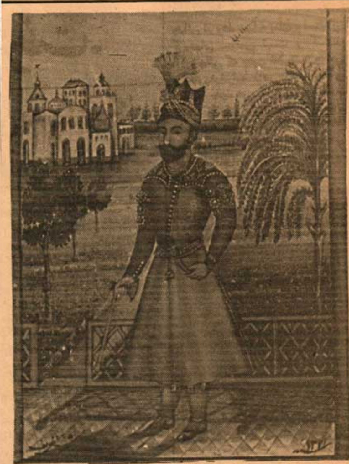
عادلشاه افشار تمام افراد خاندان افشار را کشت و آغامحمدخان قاجار را مقطوع النسل کرد و سرانجام خود نیز دستگیر و کور شد

شاهرخ میرزا که از خشم و غضب آغامحمد خان میترسید از بیم جان به میرزا مهدی مجتهد که از علمای بزرگ خراسان بود متوسل شد و او را واسطه شفاعت قرار داد. آغا محمدخان وساطت آن روحانی عالیقدر را قبول کرد و شاهرخ میرزا را قبل از ورود به مشهد در اردوگاه خود پذیرفت. خواجه قاجار شاه کور را در کنار خویش نشاند و باو مهربانی کرد و فرمان داد که جزو ملازمان رکاب او باشد. بدین ترتیب می بینیم آغامحمدخان قاجار در تمام دوران سلطنت خود کوشش میکند که وساطت روحانیون را بپذیرد و پاس خاطر آنها را نگاهدارد و اگر می بینیم که شاهرخ میرزا بعدا مورد شکنجه قرار میگیرد بخاطر اینست که شاه کور افشار نمیخواست جواهرات سلطنتی را که از نادر بارش برده بود تسلیم آغامحمد خان کند شاه قاجار جواهرات سلطنتی نادر شاه را متعلق به خزانه سلطنتی میدانست نه اولاد نادرشاه و براساس این عقیده کوشش میکرد بهر ترتیب که هست آن جواهرات پراکنده را در هر کجا که هست جمع آوری کند وزیر کلید