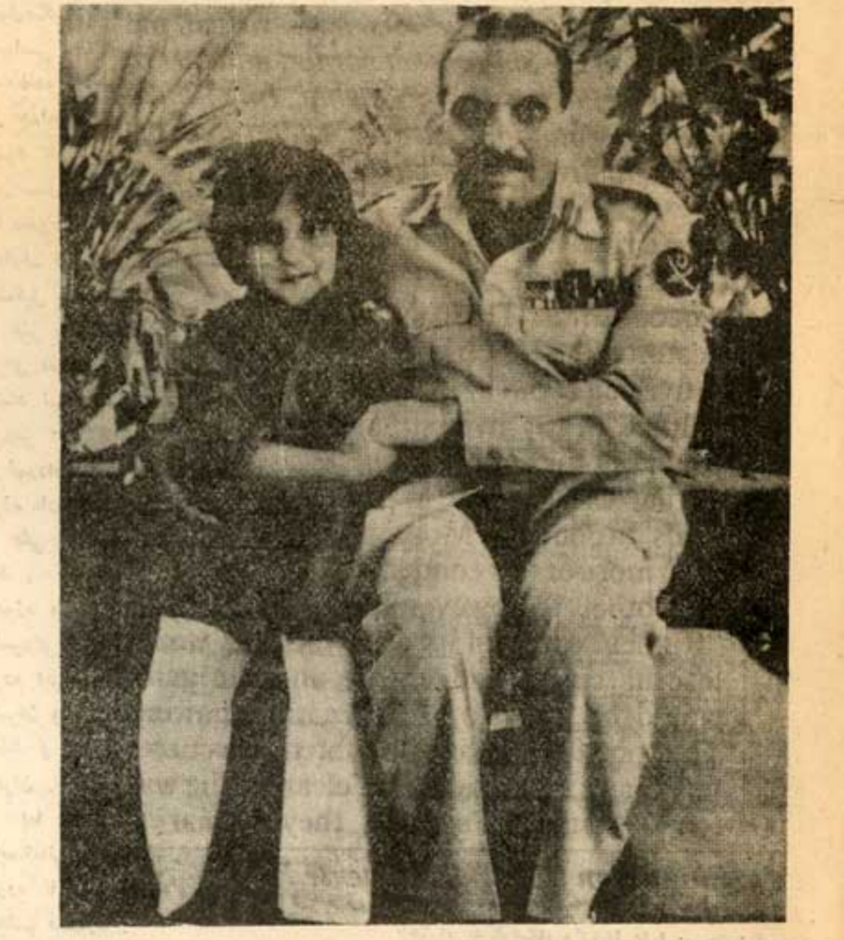
از زمانی که ضیاءالحق در اورسل

از دیدگاه دیپلمات‌های اروپای شرقی تغییر در سیاست خارجی چین سه عامل عمده دارد. ۱- ژئوپولیتیک: به علت اختلافات و خصومت بین چین و شوروی، امریکاهل بسیاری برای مانورهای سیاسی خود در روابط ابرقدرتها دارد. دهر شرایط امریکا به منظور رسیدن به هدفهای خود یا می-تواند کارت شوروی و یا کارت چین را رو کند. چین که خود نیز این موضوع را دریافته و می‌خواهد که از این تله کلاهی نیز برای خود بپوزد در مذاکرات تابستان خود با شوروی بر این است که از دو اختلاف عمده خود که یکی در مورد سرحدات مرزی و دیگری خروج نیروهای روسیه از