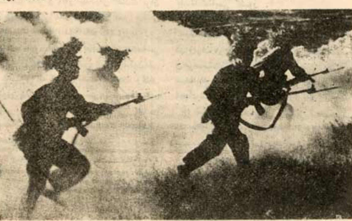
سربازان چینی هنگام حمله به ویتنام

شکافی که بین شوروی و چین بوجود آمد عمیق و غیرقابل جبران است. هرگونه تردیدی در این مورد با وقوع جنگ هند و چین در سال گذشته از بین رفت. حقیقت دارد که چین به گرمین پیشنهاد مذاکره داده ولی ناظرین بر این عقیده هستند که این حرکتی به معنی توخالی بیش زوده است. چینی‌ها گفتارند قرارداد دوستی بین شوروی و چین که سال آینده به پایان خواهد رسید، تجدید نخواهند کرد. اما یک برآورد صد در صد بدبینانه در مورد اوضاع هند و چین نیز کار صحیحی