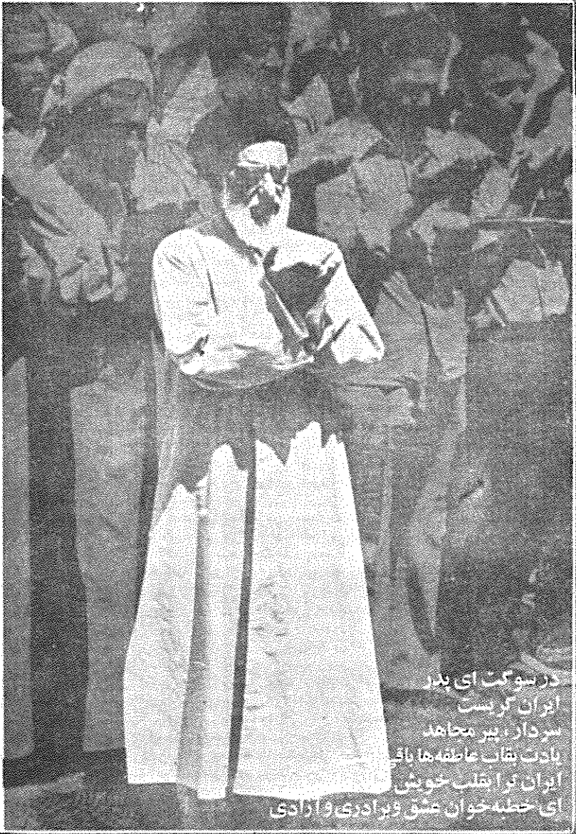
در سوگت ای پدر ایران گریست سردار، پیر مجاهد با دلت بقاب عاشقانه باقی ایران در اقلب خوش ای خطبه خوان عشق و برادری و آزادی

از همان روزی که از پیروزی انقلاب اسلامی ایران بحث و جدل بر سر ارتش و نیروهای مسلح آغاز شد، چپ نماها و "چپ روهایی سیاسی، یعنی همان کسانی که تحت پرچم های گوناگون و در بر تود فاع از مکتب مختلف میخواستند انقلاب کنونی را بسبب