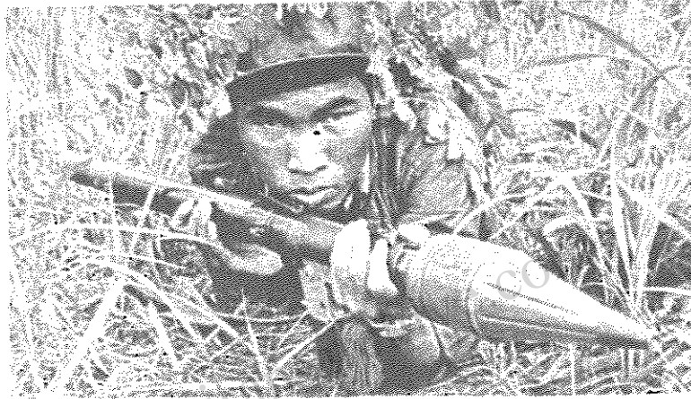
یکی از جریک های ارتش ملی کامبوجیا در حال شمرین استار

از آغاز فصل بارندگی "مونسون" سربازان ویتنامی در کامبوجیا وضع ناگوار و دردناکی را میگذرانند از نیمه مه (اواخر اردیبهشت ماه) نیروهای نظامی ویتنام مجبور به اتخاذ سیاست عدم تحرک و غیرفعال در مقابل حملات روزافزون جریکهای