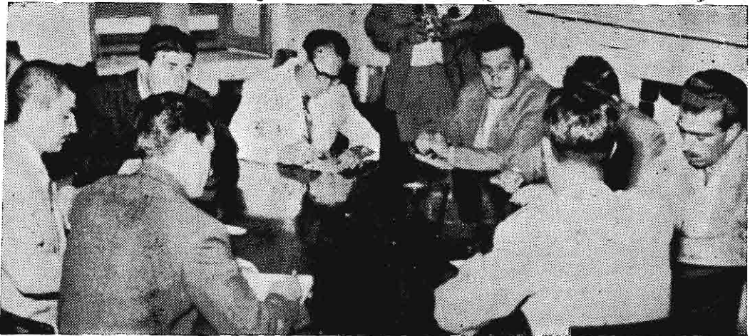
رئیس ستاد ارتش در مصاحبه امروز خود با خبرنگاران جر اید