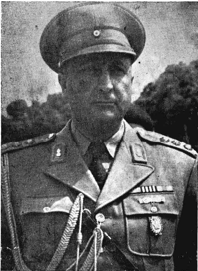
سرهنگ نصیری که برای دستگیری دکتر مصدق رفته بود

این دربار شاهنشاهی روی دربار سیاه فاروق را سفید کرد