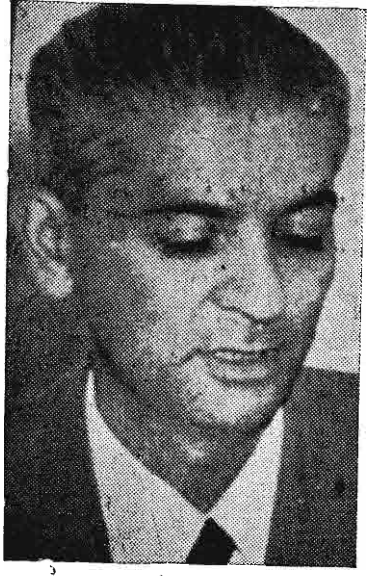
مهندس حق شناس

ساعت یازده و نیم دیشب چند افسر مسلح و قریب پنجاه شصت نفر سرباز گارد شاهنشاهی شصت تیر بدست مثل راز نانی که در کتابهای افسانه قرون وسطایی خوانده اید بخانه من ریختند و بدون این که حتی اجازه دهند من بکشم در برابر شیون طفل یازده ماهه و مادرش مرا بسعد آباد - کاخ سلطنتی - توقیف کرده - گارد شاهنشاهی بردند و در هر اطراف خانه ام نیز تا ساعت چهار صبح دوازده سرباز بی توته فرمودند. در این مقاله نمیخواهم ماجرای این جنایت - این کودتای ننگین - این دستبرد و تجاوز «شاهنشاهی» را بمشغول ملت شرح دهم بلکه میل دارم حقایق را که تا امروز قسمت مهم آن از مردم مخفی مانده است ذکر کنم: