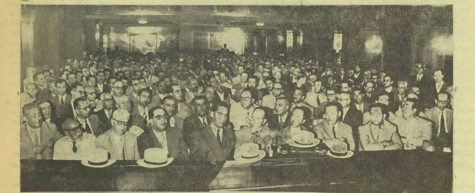
۴۸۷ نفر از طبقات مختلف پایتخت امروز برای انتخاب هیئت نظار انجمنهای اخذ رای در تالار دادگاه عالی جنائی صبح امروز حضور یافتند

امروز اعضای انجمن های نظارت برای رفرا ندم در سالن جنائی بقید قرعه انتخاب شدند محل اخذ رای برای موافقین میدان سپه و میدان راه آهن و محل اخذ رای برای مخالفین میدان بهارستان و میدان محمدیه در نظر گرفته شده است از مجموع ۴۸۷ نفر عده حاضر ۱۱۲ نفر بسمت اعضای انجمن ها و ۱۱۲ نفر بسمت تصدی صندوقها و ۱۱۲ نفر بسمت معتمدین محل بقید قرعه انتخاب شدند اعضای انجمن ها ساعت ۷ صبح فردا در محل های خود حاضر و ساعت ۸ اخذ رای شروع میشود اکثر اعضای انجمن ها استادان دانشگاه و قضات دادگستری هستند بخشنامه وزارت کشور بتهران - فردا فقط در تهران و حومه تعطیل خواهد بود فردا اخذ رای در دو محل میدان تجریش و سرپل بعمل خواهد آمد