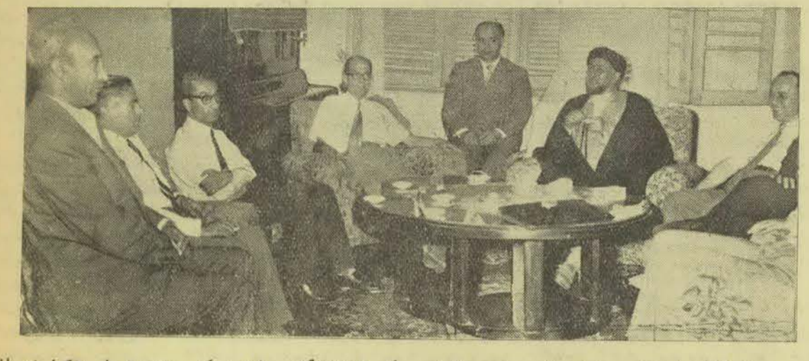
بشوات فعالیت که از طرف نمایندگان حقیقی ملت برای یک تحول اساسی و پیشه دار در کشور منگتنی میشود، اقلیت و سایر مخالفین نیز مشغول طرح نقشه های جدیدی هستند تا با کمک عمال نشاندار (امپریالیستی) توطئه جدیدی علیه نهضت ملی فراهم کنند.

بجائی نخواهد رسید بدبوی است تلاش مدیوحانه اینتعمده انگشت شمار کوچکتر از آنستکه بتواند در صنف متعدد متشکل ملت ایران کمترین خلی وارد سازد، لیکن از آن جهت که اینگونه اعمال ضد ملی و ضد آزادی همیشه برای حکومت استعماری انگلستان وسیله ای بوده و هست که با ستناد آن در دنیا بقیه در صفحه ۲