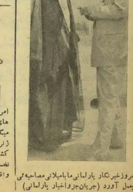
امروز خبرنگار پارلماني ماباميلاني مصاحبه مي بعمل آورد (جريان جزواخبار پارلماني)

دولت تا كزير است بملت يعني آن نيروي لايزالي كه صلاحيت قضاوت و حاكميت و اظهار عقیده دارد مراجه كند و بهر نحوي كه افراد مردم بخواهند و دستور بدهند و اراده نمايند عمل شود . بقية در صفحه ۲