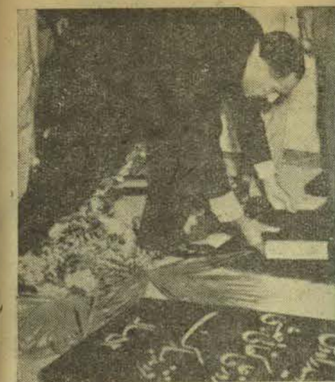
جلسه ( يك كلام ) مجيد ويكدهسته كل بر مزار ( شهيد ) ن پرويز رجائي ( ميگذارد .

شنبه ۱۳ مرداد ۱۳۴۳ - ۱۱ ذی قعدة ۱۳۷۳ - ۲۳ ژوئیه ۱۹۵۴ - شماره ۱۱۵۴