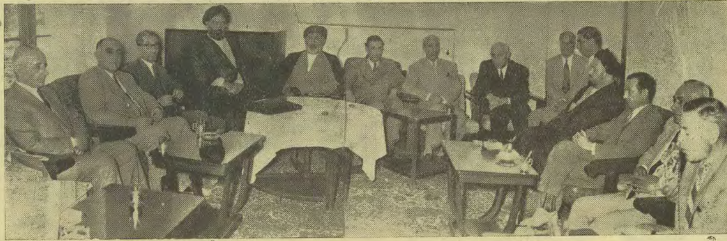
این عکس نخست وزیر را در بین اعضای فراکسیون نهضت ملی در ملاقات امروز صبح نشان میدهد.