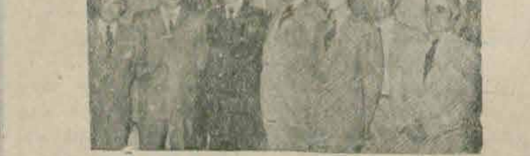
تودیع با کارشناسان روسی که برای مبارزه با بلخ با ایران آمده بودند.