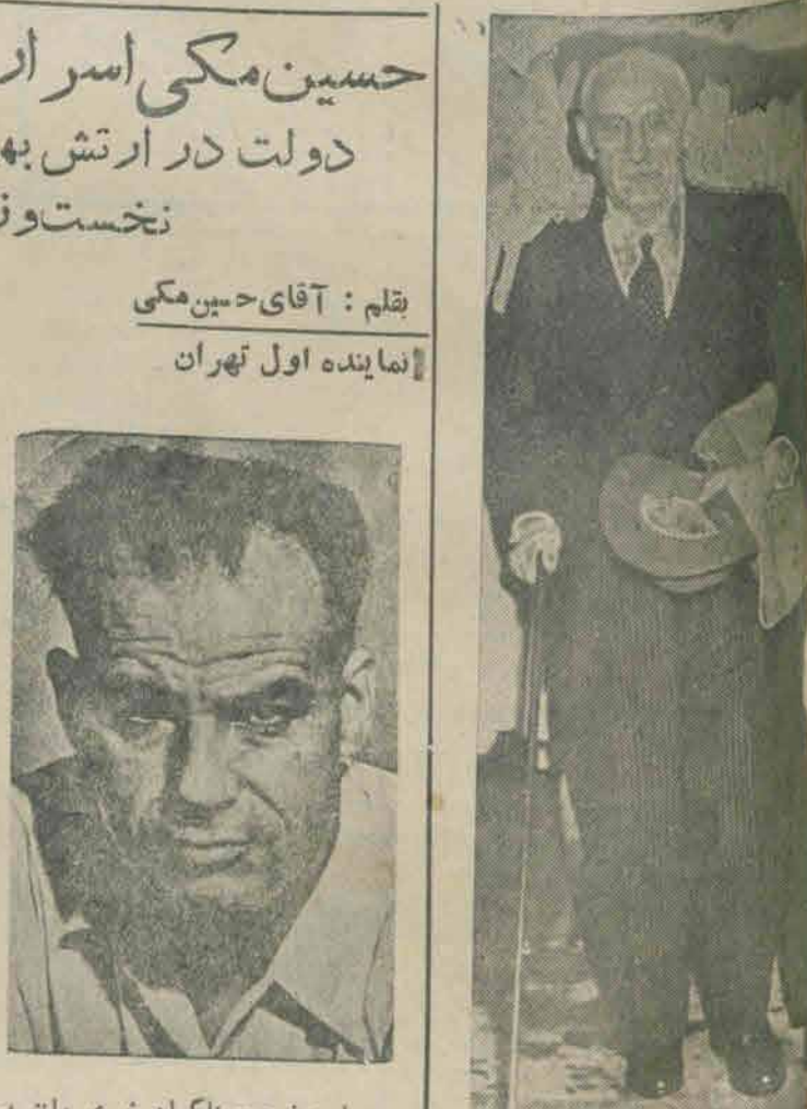
دکتر مصدق رهبر سیاسی و آزادی ایران و مظهر مبارزه برخاسته و استوار و با تدبیر و با اعتماد به نفس و با اراده و با شجاعت و با شرف و با کرامت و با اخلاق و با تعهد و با وفای دکتر مصدق در نظر داشت امروز کابینه خود را بپایلی معرفی نماید اما جریانی پیش آمده که نخست وزیر را بگریزاند و استعفا دهد یا استعفای دکتر مصدق فصل جدیدی در تاریخ مبارزات ملی ایران باز میشود و یک بحران سیاسی استوار و طولانی در صحنه سیاست ایران زودبسی خواهد کرد.

حضور آیات الله کاشانی رفت - مصدق پس از استعفا کسی را نپذیرفت و امروز کارمندان نخست وزیری را جواب گفت زیادی از نمایندگان مجلس تصمیم گرفت برای جلوگیری از تشنج و ادامه کار کابینه خود را مرکب از عناصری صالح تشکیل دهد و برنامه کابینه خود را طوری تنظیم کند که مفاد اختیارات در آن باشد تا بتواند دست باصلاحات حقیقی در داخل کشور بزند. دکتر مصدق درک کرده بود در وضع فعلی چاره ای جز این نیست که در امور اقتصادی، مالی، پولی، اداری، سازمانی و قضائی اختیارات تام داشته باشد زیرا وی در نظر داشت تعداد کارمندان (بوضعی که به قوتشان لطمه وارد نیاید) تقلیل دهد. مقررات سخت و بی معنی اقتصادی را در واردات و صادرات تقلیل دهد. موضوعات اقتصادی را که در ادارات مختلف رسیدگی میشود در یک اداره متمرکز داده و با جریان انداختن پول سطح مبادلات را توسعه دهد. مقررات بیج در بیج ادارات بقیه در صفحه ۸