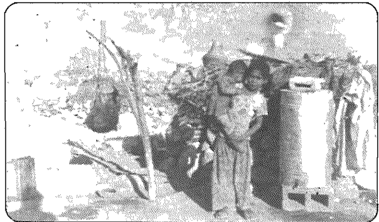
«خانه» یکی از دهقانان بی‌زمین روستای زاکین

ودختران توسط شک و حلب آب مورد استفاده خانواده راتامین می‌کنند. از برق نیز در این روستا خبری نیست. درمانگاه و بهداشت هنوز به این روستا راه نیافتاده است. اگر کسی مریض شود، باید به روستای سیاهو، دره (کیلومتر متری زاکین) برود، که اهالی آنجا خود اغلب با کمبود دارو مواجهند و ناچارند به شهر بروند.