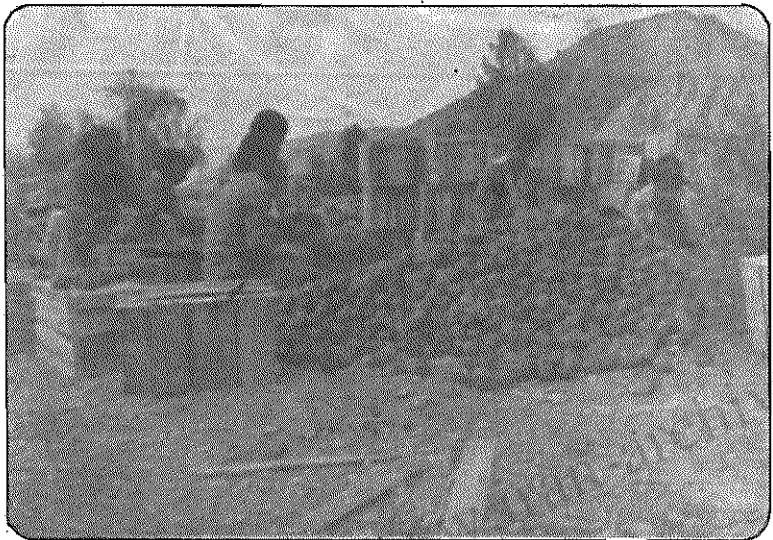
دهقانان هنگام چیدن نارنگی در صندوق

این روستا فاقد آب لوله‌کشی است و اهالی برای تأمین آب آشامیدنی از قناتی که روستای پهلوپی را مشروب می‌سازد، استفاده می‌کنند. این قنات تا روستا ۵۰ متر فاصله دارد، که زنان