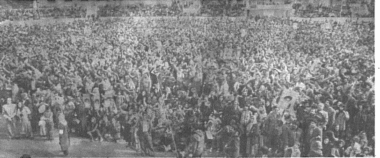
میتینگ به مناسبت جشن اول ماه مه - استادیوم نصیری تهران

زحمتکشان ایران شعار «مرگ بر آمریکا» را پرچم مبارزه خویش می‌دانند