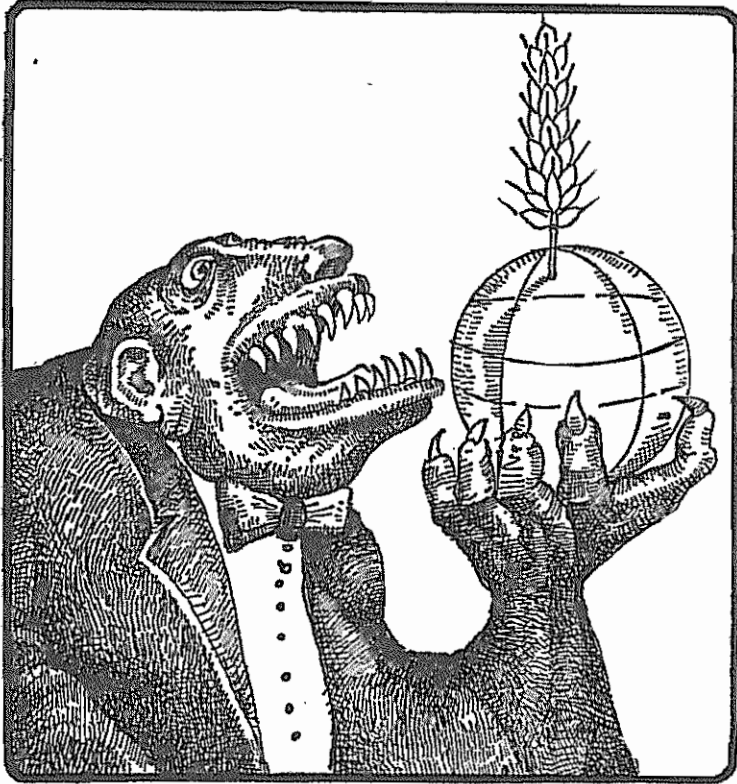
فئودالیسم (اطلاعات، ۲۶ فروردین ۶۰)

بنا به خبری که از شمال رسیده است کمبود آب در برخی زمین‌ها پایامدهای نامطلوبی خواهد داشت که باید به موقع و هر چه زودتر جلوی آنها را گرفت. یکی از عواقب جنسی این مسئله، نیاز به بکار گرفتن مقداری اضافی سموم ضد آفات است که در سالهای کم‌آبی زبان‌های بیشتری وارد میکنند. برنجکاران شمال هنگام نشای برنج همواره از سموم سی استفاده میکنند، که امسال احتیاج آنها به این مواد بیشتر است. متأسفانه اکنون در بازار این سم، که باید به هنگام نشا بکار رود، پیدا نمیشود. باید هر چه زودتر مسئولان امر